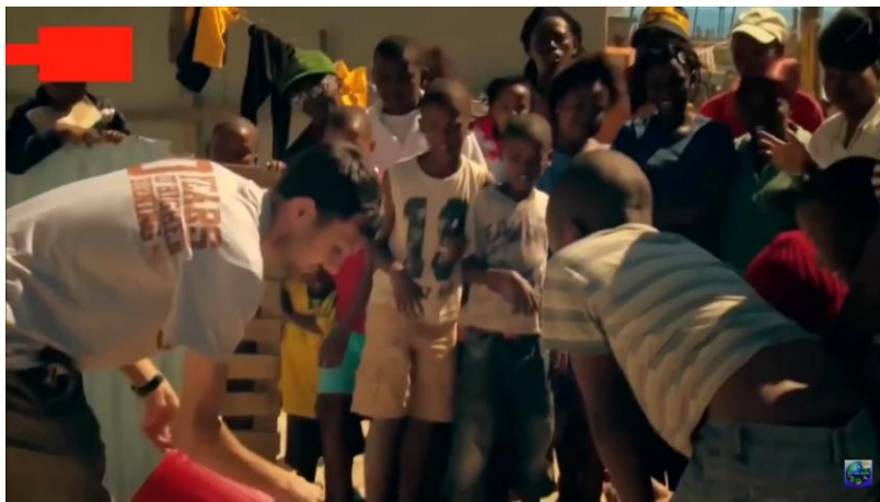
Рис. 4. Получение множества рыб из ниоткуда

Конечно, случайные свидетели могут давать разные показания. В зависимости от их восприятия. Одни могут видеть и понимать , другие – просто смотреть, а третьи и вовсе бессмысленно пялиться http://www.sciteclibrary.ru/cgi-bin/public/YaBB.pl?num=1527951484 . Поэтому эти свидетельства не равноценны.