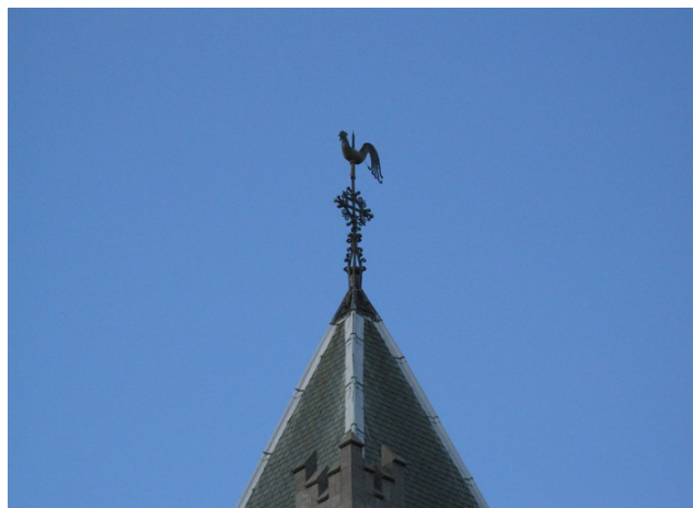
Рис. 5. Это Ирландия.