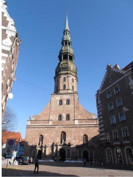
Рис. 1. Рига, церковь святого Петра.

Примеры Западной (католической) церкви Петра. Здесь Латвия – церковь Петра (кого же еще, раз наверху разместился Петух).