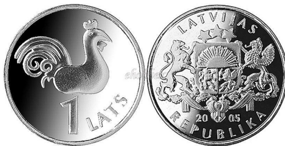
Рис. 2. Тот же петух на шпиле рижской церкви святого Петра, изображаемый на монете.