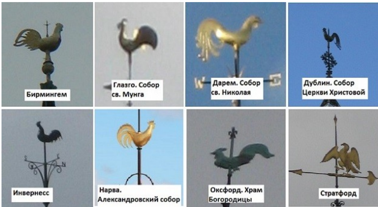
Рис. 8. Петух на шпилях западных церквей.

О чем же кричит этот Петух, взлетевший на шпили католических храмов? – Естественно, провозглашает Симонову «благовую весть» (по-гречески «евангелие»): «Ты есть Христос, сын Бога живого!»