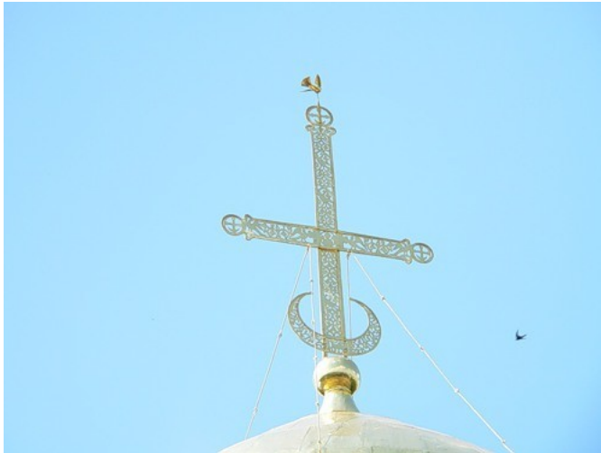
Рис. 6. Владимир Дмитриевский собор.

Вот нечто похожее на русском Владимир Дмитриевском соборе.