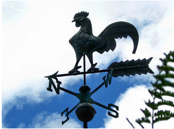
Рис. 3 Петух в качестве флюгера, символизирующего «постоянство» Петра.