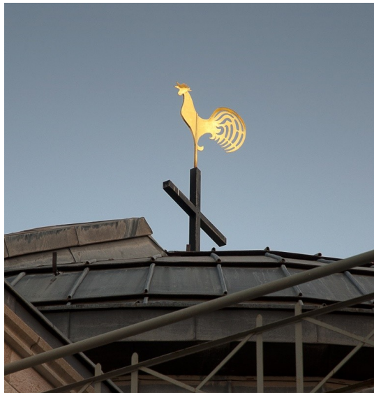
Рис. 4. Здесь Иерусалим.