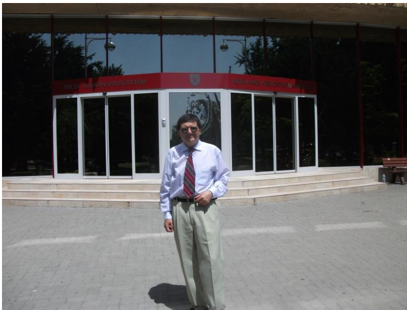
Nimeni nu-i profet în țara lui? Florentin Smarandache în fața Universității din Pécs

Printre cei 10 oameni de știință (2 din Australia, 2 din Italia, 2 din SUA, câte unul din Egipt, India, Israel, și Rusia) care au primit în 12 iunie 2010 la Universitatea din Pécs, Ungaria, Medalia de Aur pentru Știință acordată de către Academia de Științe “Telesio-Galilei” (organizație 5 neguvernamentală internațională cu sediul în Marea Britanie), s-a aflat și prof. univ. dr. Florentin Smarandache (n. 10.12.1954, Bălcești, Vâlcea) , cu dublă cetățenie, româno-americană, de la Facultatea de Științe din Universitatea „New Mexico”, Gallup, statul New Mexico, SUA.