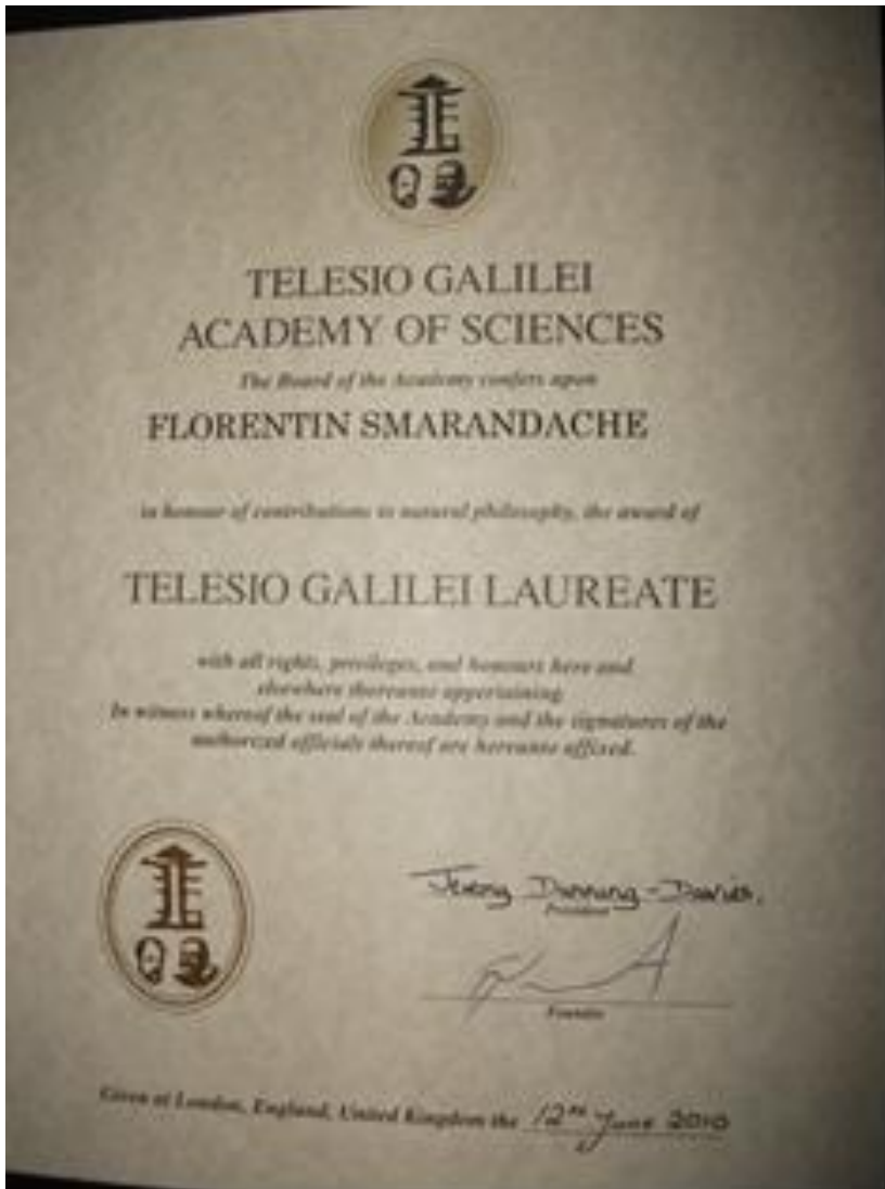
Diploma, 12 iunie 2010, Universitatea din Pécs