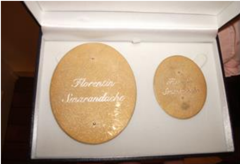
Medalia de aur, 12.06 2010, Univ. din Pécs