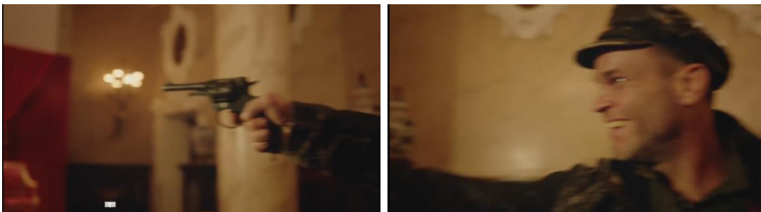
Рис. 1. Сладостный миг убийства («Голос Омерики & Чача — Теория заговора»)

Ограничимся всего одной иллюстрацией ненависти, которую каждый может самостоятельно сколь угодно расширить Рис. 1.