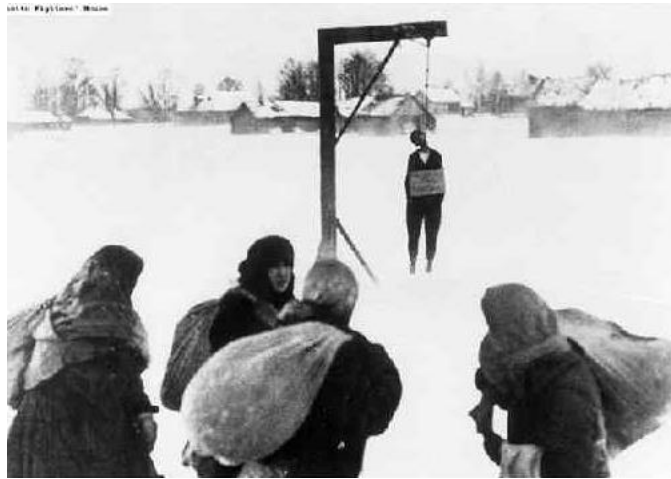
Рис. 6. Достигнутая свобода «в духе»

согласившись на принуждение к рабству. Утешив себя иллюзией свободы «в духе» (то есть в каких-нибудь своих мыслях ) Рис. 6.