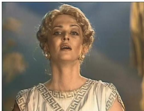
Рис. 2. – Все мы жаждем любви – это наша святыня («Прекрасная Елена»)

Не менее интересна тема любви, с которой каждый по жизни тоже сталкивается. Предмет мечтаний многих, хотя доступный не всем Рис. 2.