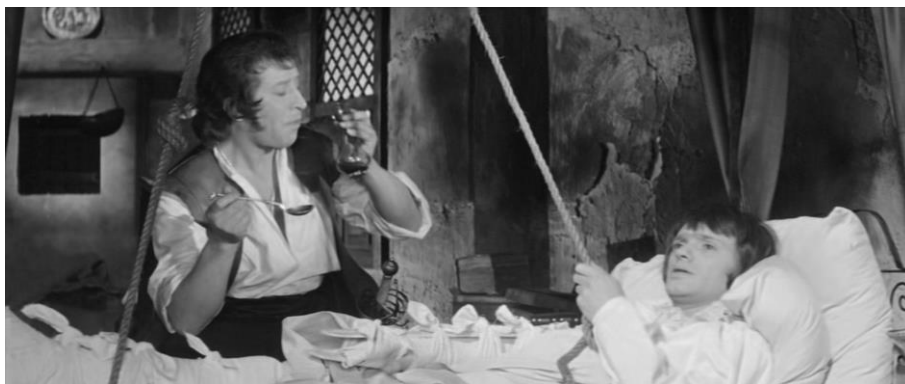
Рис. 4. – Я приехал сюда уже влюбленный до потери сознания, хотя мне не было еще известно, в кого именно я влюблен

Она подобна вулканическому извержению, неподконтрольному разуму («Рукопись, найденная в Сарагосе») Рис. 4.