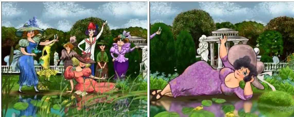
Рис. 5. – Я тебя не знаю, но уже люблю. Приходи, милый («Жил министр обороны»)

Это невесты, которых по требованию Христа еще только предстоит возненавидеть.