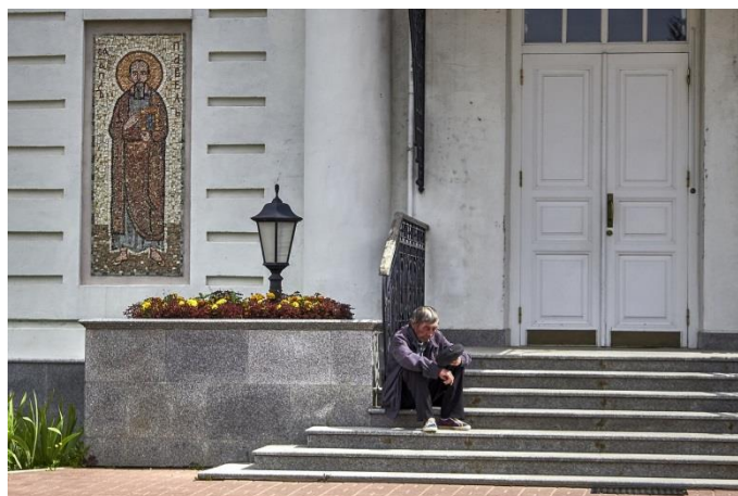
Рис. 9. Нищий на ПАПЕРТИ

Туда-то и допускаются нищие попрошайки, в подтверждение слов Христа о необходимости всеобщей любви Рис. 9.