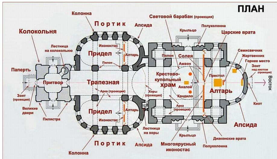
Рис.8. ПАПЕРТЬ расположена снаружи у входа в храм.

Положение паперти на плане храма показано на Рис. 8.