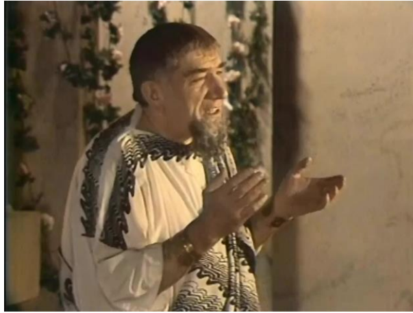
Рис. 3. – Любовь, прекрасная царица, это великая тайна, сокрытая в узорном поясе богини Афродиты

Она подобна вулканическому извержению, неподконтрольному разуму («Рукопись, найденная в Сарагосе») Рис. 4.