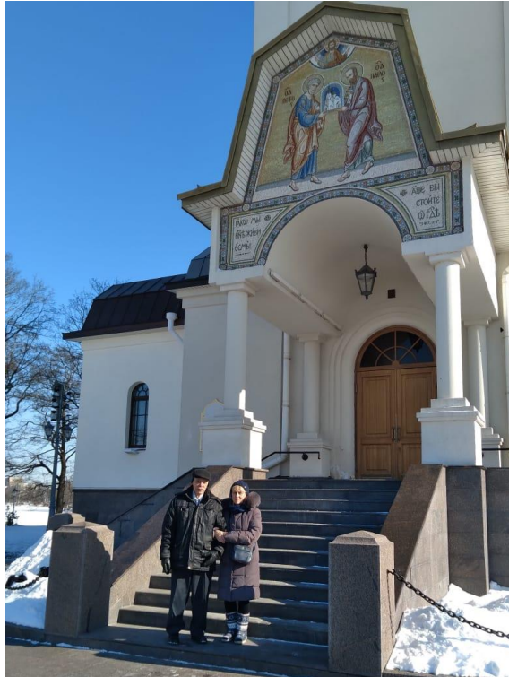
Рис. 11. Молодожены на паперти

ПАПЕРТЬ это место для проявления любви всеобщей , а храм – индивидуальной , направленной непосредственно к богу. В надежде на его благосклонность.