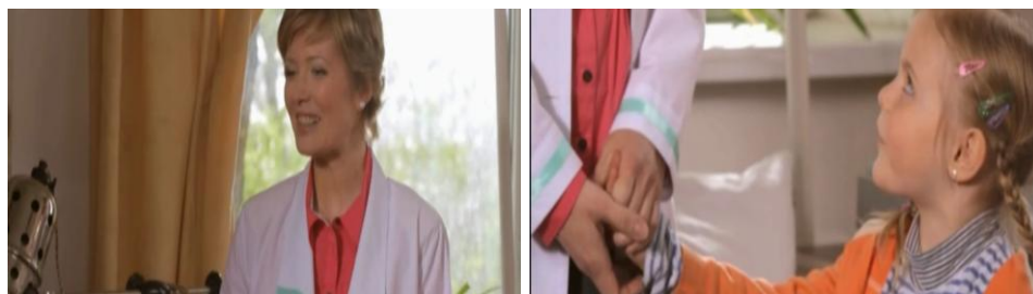
Рис. 3. Я хóчу, шоб наш майбúтний тáто знав всэ

Она же с блеском придумала как раздобыть будущего тату Рис. 3.