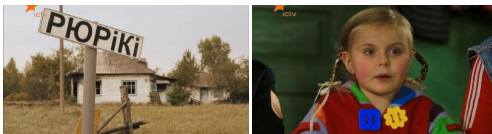
Рис. 2. – Математика потрібна жінки, щоб рахувати гріши.

А действительно зачем вообще нужна математика? Наилучший ответ «для чего нужна математика?» дает Танечка («Рюрики») Рис. 2.