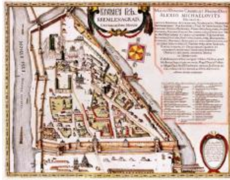
Fig. 6. General view of Moscow.