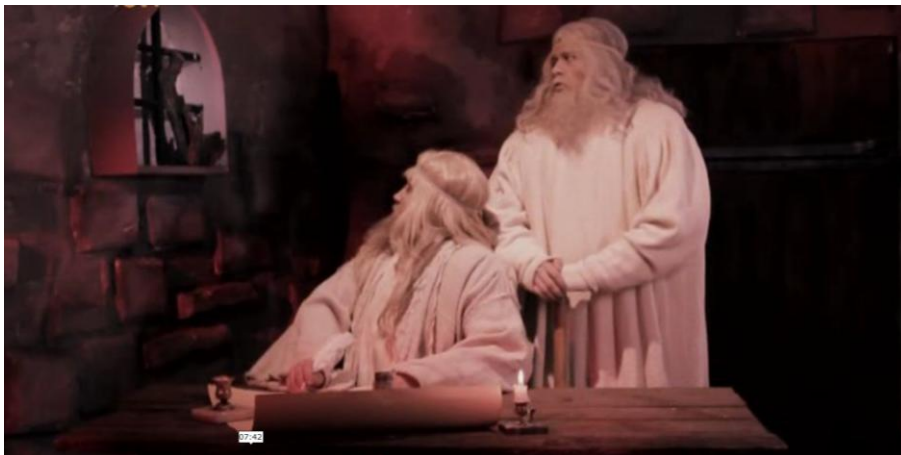
Рис. 7. Пиши: ОТНЮДЬ; местами – ШИБКО (фильм «Рюрики»)