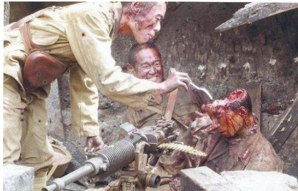
Рис. 3. Японские самураи за дегустацией свежего МОЗГА

МОЗГ это МАЙАН или, возможно, МАЖЖАН, а также МУЗГЕНО или МАЗГА. Последнее ближе всего хотя это лишь частный случай КОСТНОГО МОЗГА. Обозначение именно МОЗГа в таком понимании отсутствует (он, вероятно, называется как-то ИНАЧЕ), хотя внутрикостные жировые отложения тоже считаются МОЗГОМ, по-видимому, по сходству вкуса Рис. 3.