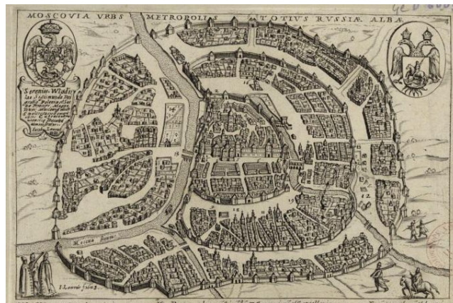
Рис. 6. Общий вид Москвы.

Исходный план размещения Москвы, назначенной быть МОЗГОМ, практически идеален. Есть судоходная река, связывающая ее с югом и севером. Центр расположен на высоком Боровиковском холму, со всех сторон окруженному реками, имеющими требуемое искривление. И дополненными городскими стенами. Со стороны севера нападение менее