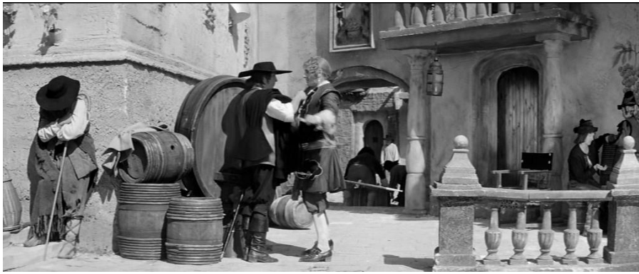
Рис. 1. – Смотри, ни глотка вина. Плащ на плечо! («Рукопись, найденная в Сарагосе»)

Теперь это упущенная этимология. Мачту оставим без комментариев. Дальше, конечно, обычная белиберда.