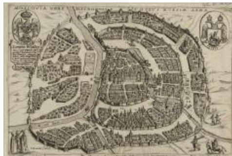
Fig. 6. General view of Moscow.

The original plan for the location of Moscow designated to be the brain is almost perfect. There is a navigable river connecting it with the south and the north. The center is located on the high Borovikovsky Hill, surrounded by rivers with the required curvature and supplemented by city walls. It is less likely to be attacked from the north, and it has to go against the current from the south, which makes it difficult for a sudden attack.