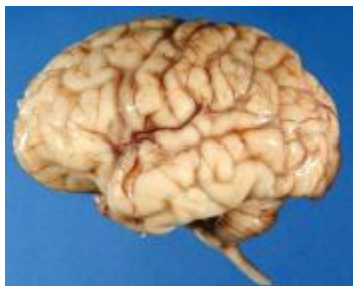
Fig. 2. Appearance of the МОЗГ (brain)

Where does this characteristic of the object in question come from? Naturally, from its appearance, represented by numerous CURVATURES OR CURVES, sharply different from other parts of the body (Fig. 2).