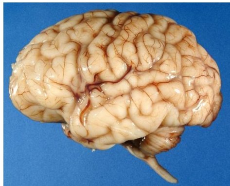
Рис. 2. Внешний вид МОЗГА

Откуда же возникает такая характеристика рассматриваемого объекта? – Естественно, из его внешнего вида, представленного многочисленными ИСКРИВЛЕНИЯМИ или ИЗГИБАМИ, резко отличающимися от прочих частей тела рис. 2.