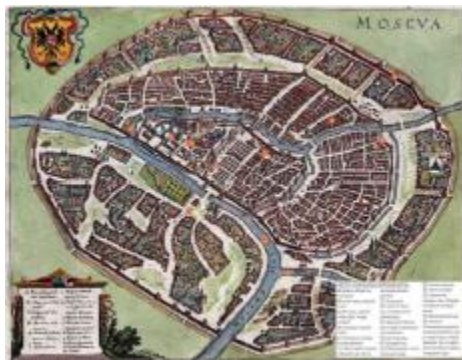
Fig. 5. Plan of general view of Moscow.

Let us now see the initial map of Moscow (Figs. 5-7).