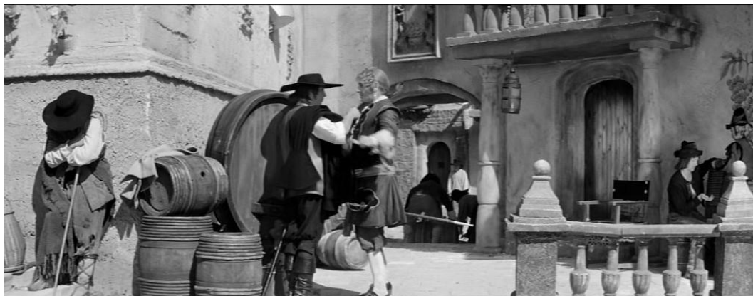
Fig. 1. – No sip of wine. A cape to your shoulder! (film «The Manuscript Found in Saragossa»)

Now it's a missed etymology. We'll leave the mast with no comment. Next, of course, the usual gibberish.