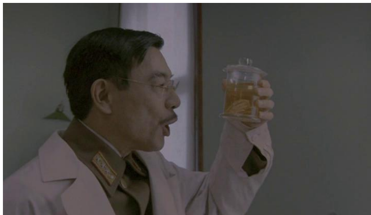
Fig. 4. What a beauty!.. (The Sun movie)

At the same time, the Japanese emperor is a scholarly intellectual, according to the Russian liberal (Fig. 4).