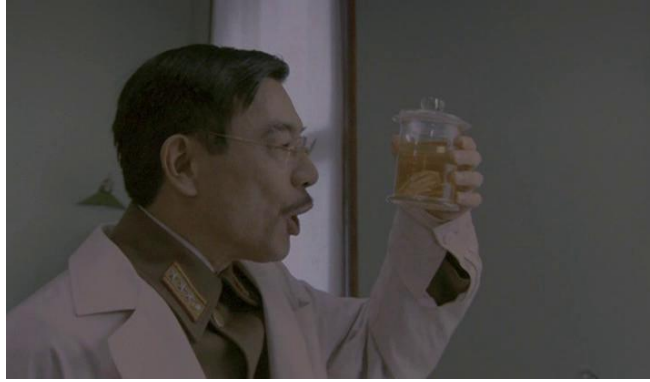
Рис. 4. Какая красота!.. (фильм «Солнце»)

Итак, происхождение слова МОЗГ Крыловым не раскрывается.