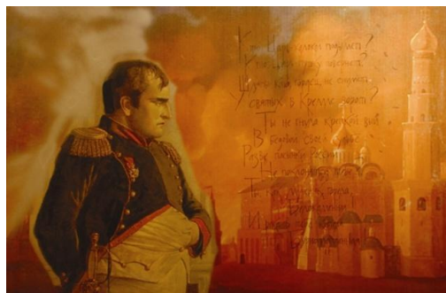
Рис. 4. Сожжение МОСКВЫ Наполеоном