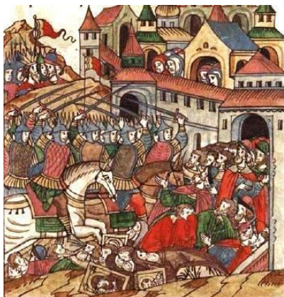
Рис.2. Сожжение МОСКВЫ Тохтамышем