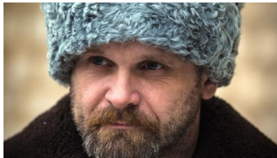
Рис. 8. Герой Донбасса Алексей Мозговой – МОСКОВСКИЙ.

И пока МОСКВА остается МОЗГОМ, сердце России – Донбасс не победить. Кстати, фамилия Мозговой тоже означает МОСКОВСКИЙ (Рис.8).