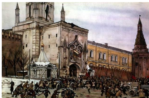
Рис. 5. Разгром Кремля большевиками 15 ноября 1917 года