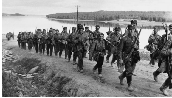
Рис.6. 1941 год. Немцы уже видят в бинокль пригороды МОСКВЫ