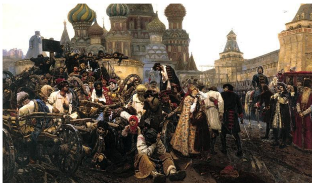
Рис. 3. Захват МОСКВЫ лжецарем Петром