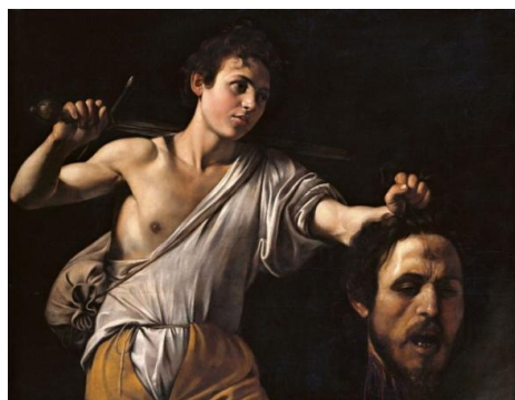
Рис.1. Метафора – маленький Давид поражает могучего Голиафа ударом в голову, то есть в МОЗГ

Понятно, что уничтожение России должно начинаться с поражения ее МОЗГА (рис. 2 – 7).