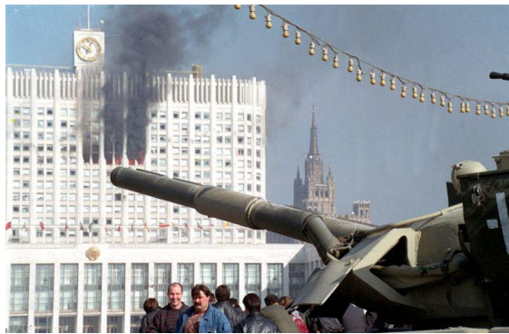
Рис.7. 1993 год. Лицо демократии в МОСКВЕ

И пока МОСКВА остается МОЗГОМ, сердце России – Донбасс не победить. Кстати, фамилия Мозговой тоже означает МОСКОВСКИЙ (Рис.8).