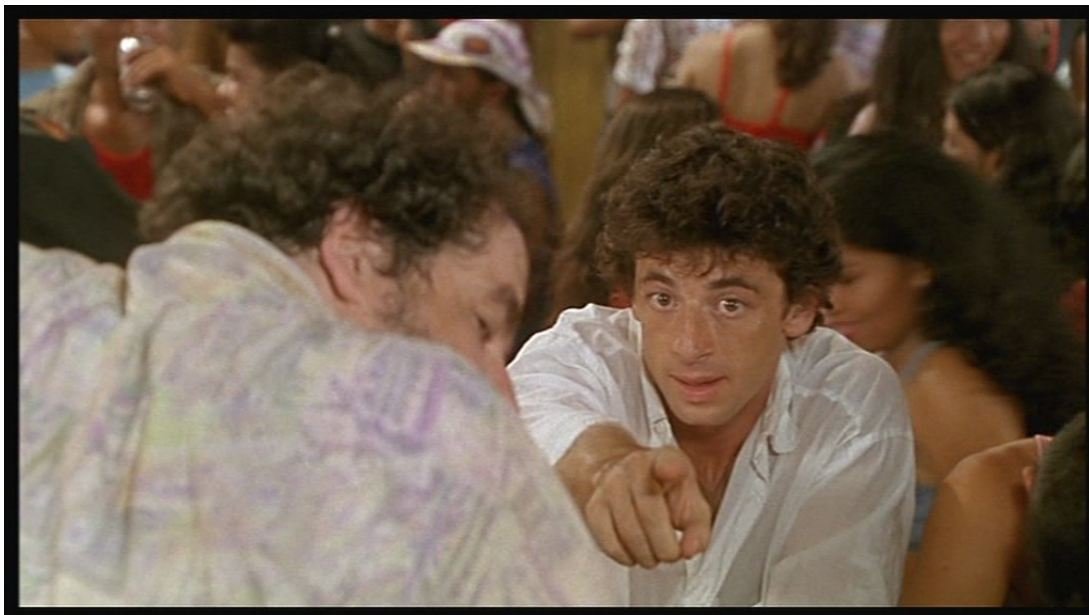
Рис. 1. – Чего ты хочешь? – ЭТО! (фильм «Ягуар»)