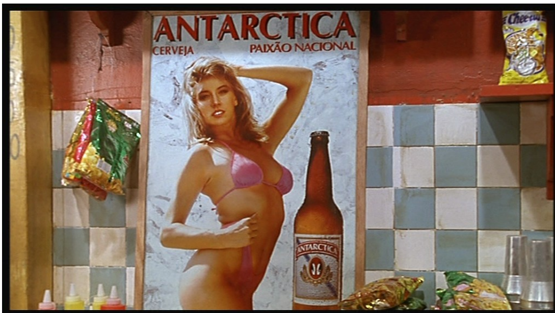
Рис. 2. – Пиво или девчонку? – Не понимаю (не знаю этих названий).

Вначале, когда названия еще отсутствуют, возникают именно эти универсальные обозначения, используемые взамен имен (местоимения) . Их можно даже назвать не местоимениями , а до- или прежде- имениями.