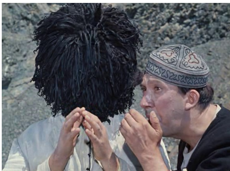
Рис. 6. – БЕ-Е-Е (Предмет обмена - барашек!).

Слово МЕНА образовано двумя частями МЕ + НА. Первое, по-видимому, и является собственно обозначением самого обмена или возможный его предмет, второе же – НА означает возьми , т.е. предложение его выполнения. Оба являются исходными простыми словами, соединенными в одно новое сложное слово. Исходное слово МЕ (в произношении МЭ, вариант – БЭ) в языке не исчезло и до сих пор применяется с долгим Е – МЭ-Э-Э или БЭ-Э-Э с вполне понятным исходным значением – барашек или козленок , предлагаемые к обмену или же приобретенные посредством обмена рис. 6 (из кинофильма «Кавказская пленница, или Новые приключения Шурика»).