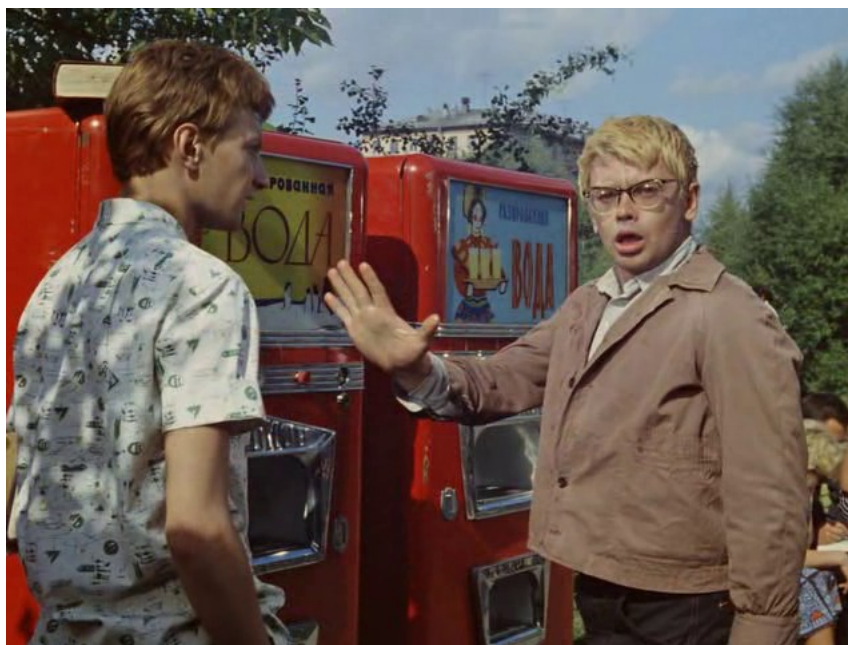
Рис. 3. – Кто это? – А-а-а, так это ж Лидка с параллельного потока.

обезвреживания. Теперь это считается признаком древности и даже дикости, давно и успешно преодоленным «прогрессом». Однако, всегда ли мы сами желаем сообщать свое имя первому встречному, особенно не симпатичному, с которым лучше общаться посредством местоимений, прямо не называя себя? Символически защищая этим что-то свое внутреннее и сокровенное. И что мы хотим узнать о заинтересовавшем нас лице в первую очередь? – Имя, конечно. Нам при этом уже недостаточно просто местоимения рис. 3, 4.