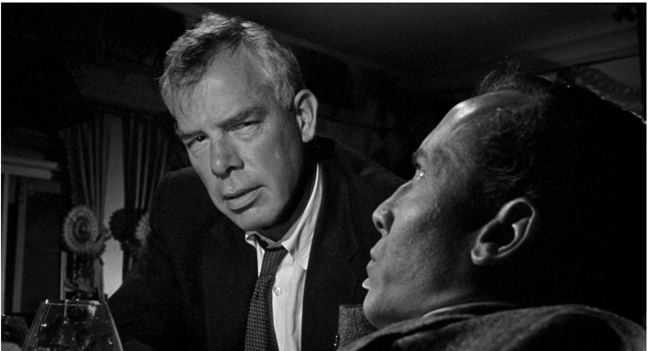
Рис.7. – Знаешь, что я думаю? – Нет. – Что ты хренов интеллигент (фильм «Корабль дураков»).

Порой начинает казаться, что признанный ученый почти такое же ругательство, как хренов интеллигент . Планово обученный графоман на зарплате. Хуже этого только креаклы – «эксперты» и телеведущие. Ниже падать уже просто некуда.