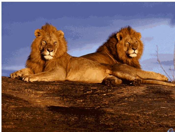
Рис. 3. Пропорции тела лежащих львов.

Отсюда делаются далеко идущие предположения о переделке в древности исходной головы Сфинкса. Когда-то бывшей якобы значительно большей.