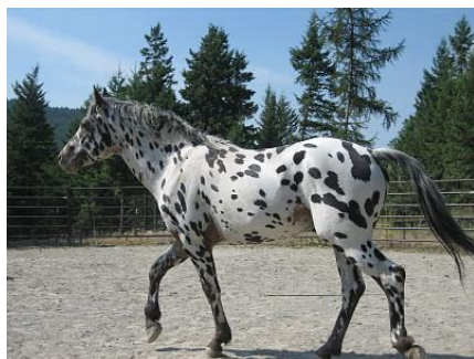
Рис.10. Пятнистая масть лошади.

Возможно поэтому специальное выведение соответствующих пятнистых животных как исключительно царских. Сразу же зрительно выделяющих царя в толпе окружающих. Вот некоторые примеры подобной “царственной” масти Рис. 10 - 12.