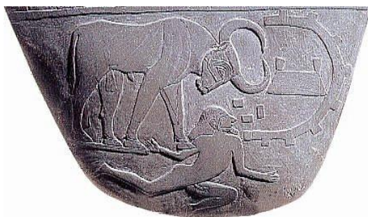
Рис. 14. Таблетка Нармера.

Бык здесь символизирует несокрушимую мощь, тогда как гепард - быстроту и натиск.