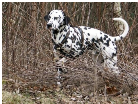
Рис. 11. Пятнистая масть собаки.