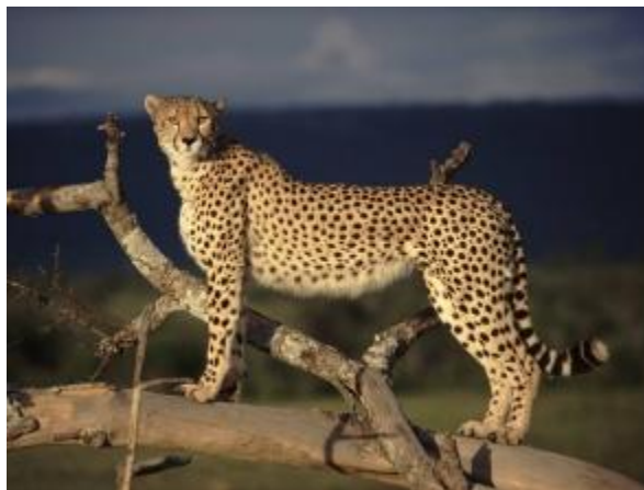
Рис. 6. Пропорции тела гепарда.

Есть ли в природе какое-либо животное, соответствующее телу Большого Сфинкса? – Есть. Это животное – гепард. Причем именно гепарда держали во дворцах египетские фараоны . Вот его внешний вид Рис. 6.