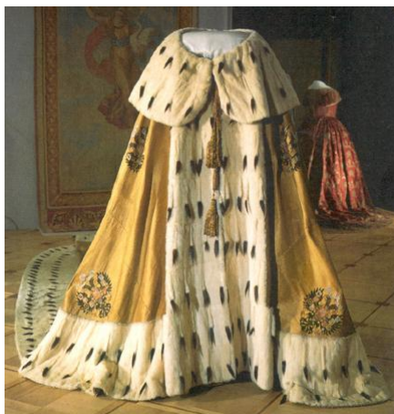
Рис. 9. Пятнистая царская мантия.

И ритуал царского миропомзания – невидимого пятнания, обозначающего выделенность и отмеченность. И пятнистый наряд шута горохового, изображающего якобы царя. И “божья” отметина Горбачева, по мнению инквизиции, – пятно дьявола. И даже игра в пятнашки, где один единственный “запятнанный” всегда является ВЕДУЩИМ, а несколько незапятнанных, т.е. никак не отмеченных (рядовых) – ведомыми. Он за ними гоняется, а они от него убегают. Это очевидная игра “в фараона”.