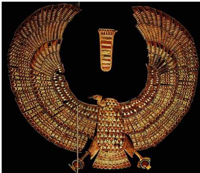
Рис. 4. Символ Верхнего Египта – гриф.

Могут ли историки здесь попросту ошибаться? – Запросто, они ведь не биологи. Как могут, например, назвать символ Верхнего Египта? – Коршун или орел. А правильный ответ – гриф Рис.4.