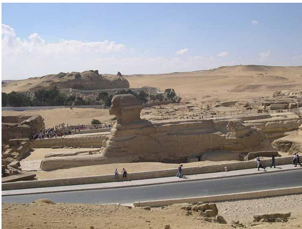
Рис. 1. Большой Сфинкс. Вид сбоку.

Замечено, что пропорции Большого Сфинкса, считающегося телом льва, имеют явную несоразмерность размеров головы. Которая выглядит слишком малой для этого тела. Вот его общий вид рис. 1.