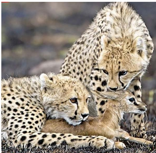
Рис. 7. Лежащий гепард.