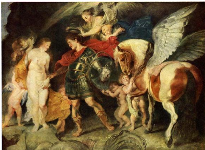
Рис. 13. Пятнистая ( пегая ) масть Пегаса .

Сюда же относится пегая масть с крупными пятнами ставшая впоследствии мифологическим “крылатым Пегасом ” художников и поэтов Рис. 13.