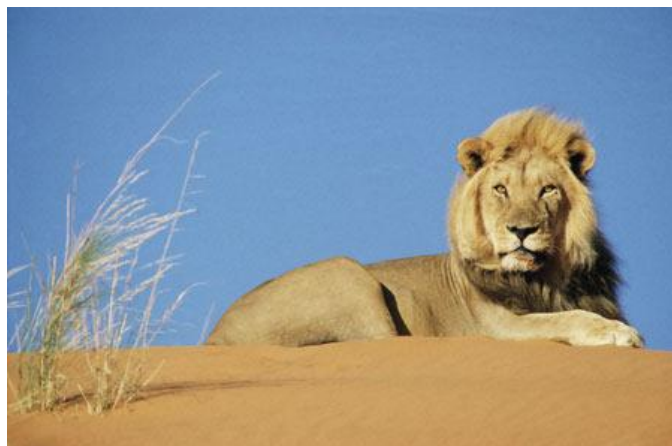
Рис. 2. Пропорции тела лежащего льва.

Для сравнения пропорции тела льва рис. 2 – 3.