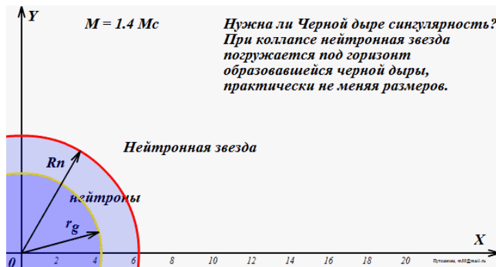
Рис.3 Процесс коллапса нейтронной звезды в черную дыру. Нейтронный шар просто уходит под горизонт, не меняя своих размеров (не падая на сингулярность)

Изначально нейтронная звезда на анимации имеет массу 1,4Мс – масс Солнца. В процессе эволюции она поглощает внешнее вещество порциями (для определенности) по 0,01Мс. Масса звезды M=kM_c увеличивается, как показано на рисунке. При увеличении её массы соответственно возрастают также её объем V и радиус R_{нз} (шкала X на рисунке - в километрах) – это внешний красный контур на рисунке. С учетом плотной упаковки шаров k_{пл} :