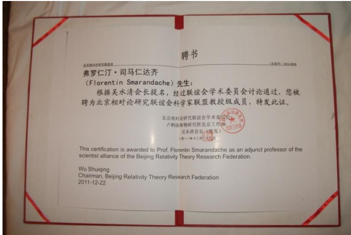
Diploma de Doctor Honoris Causa primită de la Universitatea Jiaotong din Beijing, în decembrie 2011

volum, care va putea fi citit și în variantă electronică pe site-ul său, de la universitatea americană la care lucrează.