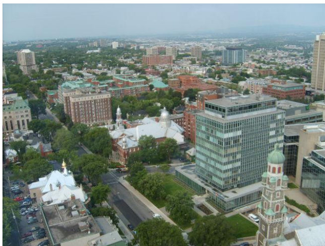
Vedere panoramică parțială a orașului Québec

Florentin Smarandache a participat la cea de-a X-a ediție a Conferinței Internaționale de Fuziunea Informației FUSION 2007, care s-a desfășurat la Hotelul „Loews Le Concorde” din Québec, Canada, organizată de Societatea Internațională pentru Fuziunea Informației.