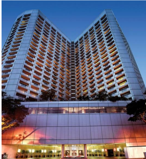
Hotelul „Fairmont Singapore”

În perioada 9-12 iulie 2012, Florentin Smarandache va participa la lucrările celei de-A XV-a Conferințe Internaționale de Fuziune a Informației, FUSION 2012, din Singapore, la Centrul de Congrese „Raffles”, care are două hoteluri: „Swissotel The Stamford Singapore” și „Fairmont Singapore”.