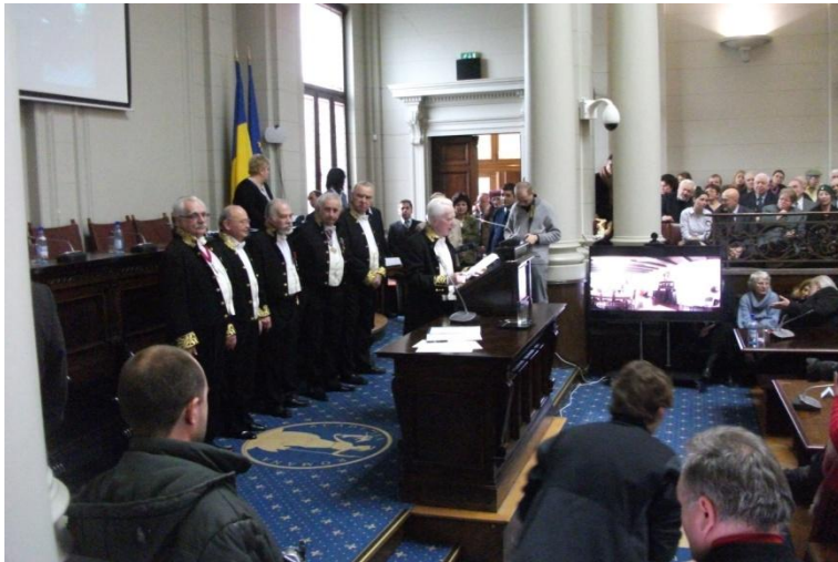
Festivitatea de premiere din Aula Academiei Române

Nu mai puțin emoționantă decât primirea acestui premiu a fost întâlnirea cu academicianul (matematician de anvergură mondială) Solomon Marcus (n. 1925, Bacău, membru corespondent al Academiei Române din 1993, membru titular din 2001), cu care colaborase în domeniul lingvisticii matematice (aceasta, mai demult, înainte ca vâlceanul nostru să emigreze).