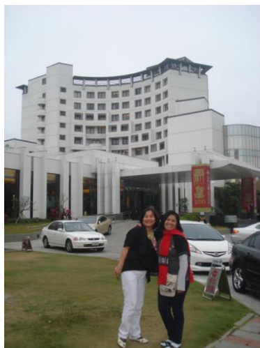
„Taiwan – Kaohsiung – Hotelul Garden Villa, Hotelul „Garden Villa” din Kaohsiung

În acest an se împlinesc 100 de ani de la proclamarea Republicii China, al cărei continuator se proclamă Taiwanul, așa că Banca Centrală a Taiwanului a emis monede și bancnote jubiliare, cu inscripția „Centenarul Republicii China”.