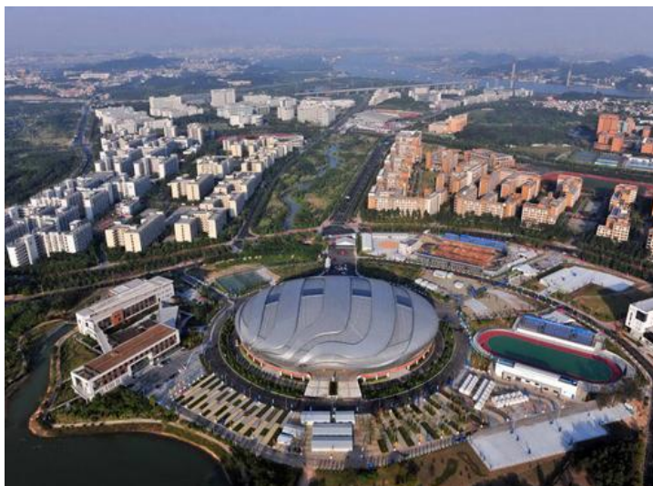
Vedere aeriană a unei părți din „Orașul universitar” din Guangzhou