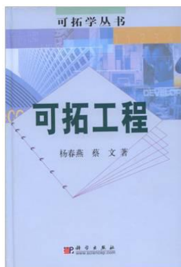
Coperta ediției a doua a cărții „Inginerie extinsă”