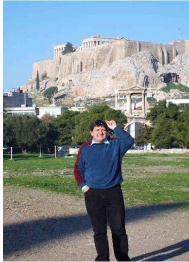
Florentin Smarandache, la Atena, sub Acropole (2006)

La Editura “Kàpa” din orașul Korydallos (o suburbie a municipiului Pireu, aflat la 12 km sud-vest de Atena, capitala Greciei) a apărut în acest an, în limba greacă, volumul de versuri „Distihuri paradoxiste” (Παράδοξα Δίστιχα) al lui Florentin Smarandache, matematician și scriitor.