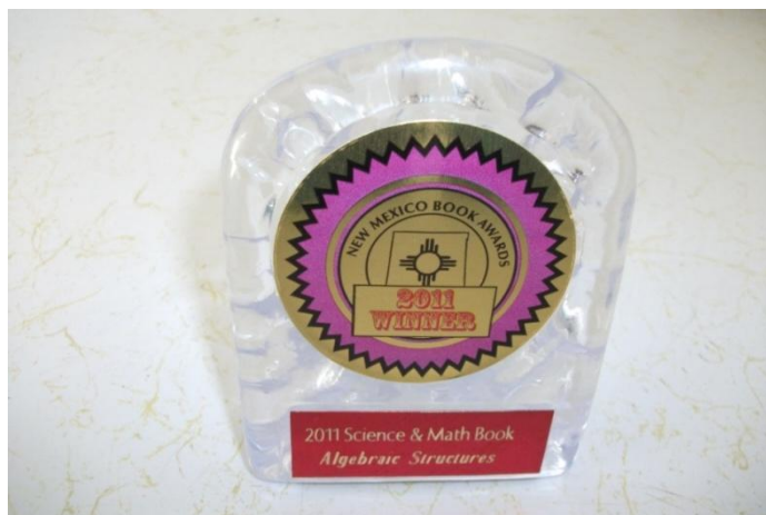
Premiul „New Mexico Books Award” 2011

Înmânarea premiului a avut loc în cadrul unei festivități numite „Banchetul Premiilor pentru Carte din New Mexico”, organizat la hotel „Elegante” din orașul Albuquerque, statul federal New Mexico: banchetul a început la ora 18 (meniul acestuia a costat 48 $, la fel ca anul trecut – pui, gătit după rețeta italiană „Marsala”, piure de cartofi, salată, legume de sezon, ruladă, cafea, ceai cu gheață și tort de morcovi, iar vegetarianii au putut să-și comande din timp, prin telefon, meniul vegetarian preferat).