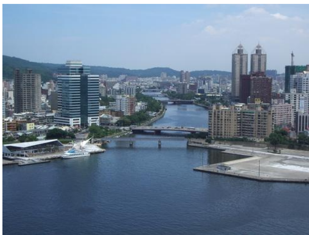
„Taiwan – Kaohsiung – Raul Dragostei”, Gura Râului Dragostei, din orașul Kaohsiung

Florentin Smarandache se va afla în perioada 8-10 noiembrie 2011 într-un loc foarte exotic pentru români: orașul Kaohsiung (1,5 milioane de locuitori), al doilea ca mărime din Taiwan, unde va prezida o secțiune la A VII-a Conferință Internațional de Calcul Granular (notată prescurtat GrC 2011). Este vorba despre Secțiunea Paralelă C4, „Modelarea sistemelor și aplicații”, care se va desfășura miercuri, 9 noiembrie 2011, în intervalul orar 10:30-12:10, în Sala 203 a Hotelului „Garden Villa”, cel mai modern centru de conferințe științifice din Taiwan, situat într-o zonă verde, cu o splendidă vedere înspre Lacul cu Lotuși.