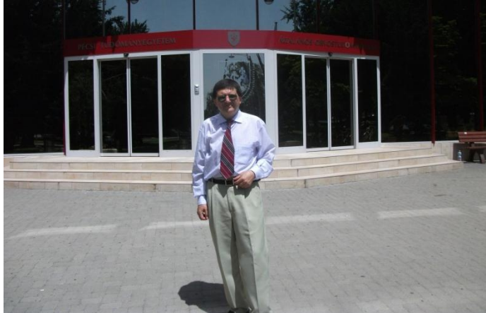
Florentin Smarandache în fața Universității din Pécs

Printre cei 10 oameni de știință (2 din Australia, 2 din Italia, 2 din SUA, câte unul din Egipt, India, Israel, și Rusia) care au primit în 12 iunie 2010 la Universitatea din Pécs, Ungaria, Medalia de Aur pentru Știință acordată de către Academia de Științe "Telesio-Galilei" s-a aflat și prof. univ. dr. Florentin Smarandache.