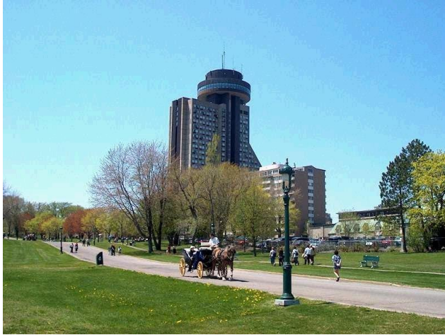
Hotelul „Loews Le Concorde” din Québec