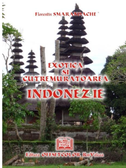
Coperta celei a 101 cărți publicate de Florentin Smarandache

În această săptămână, a apărut la Editura „Offsetcolor” Râmnicu Vâlcea cea de-a 101 carte a lui Florentin Smarandache: „Exotica și cutremurătoarea Indonezie” (cutremurătoare la figurat, dar și la propriu, pentru că a fost surprins aici de un puternic cutremur, Indonezia fiind situată în zona seismică numită în geografie și în seismologie „Centura de Foc a Pacificului”). De format normal, 124 de pagini, cu multe fotografii, volumul cuprinde notele călătoriei întreprinse de autor în luna mai 2006, la universități indoneziene, unde a prezentat câteva conferințe de