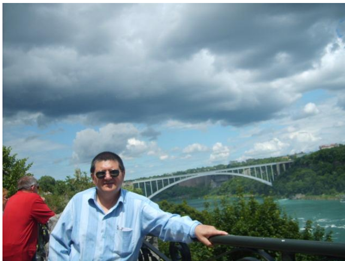
Florentin Smarandache pe malul râului Niagara

La Editura “Silviana” din Râmnicu Vâlcea a apărut un nou jurnal de călătorii ale matematicianului și scriitorului Florentin Smarandache. Cartea se intitulează „Frate cu meridianele și paralelele”, vol. 6. și cuprinde impresii de călătorie din perioada 30 aprilie 2009 – 06 ianuarie 2010.