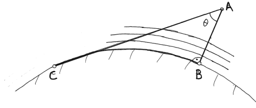
Figura 2: Situación real de una espira formada por tres tuberías.

cuenta que no tenemos porque ceñirnos a dispositivos de pequeño tamaño. Siguiendo con el razonamiento, en este nuevo diseño se ve claramente que el gradiente coincide, como en el anterior, con el tramo de tubería normal al suelo, el que mayor número de superficies equipotenciales penetra por unidad de longitud. Pero en el tramo \overline{AC} el número de superficies equipotenciales por unidad de longitud que penetra no es lineal, aunque coincida el número. Esto es así porque el Campo gravitatorio terrestre tiene simetría esférica. O, lo que es igual, y se tendrá ocasión de calcular: las fuerzas de los tramos \overline{AB} y \overline{AC} ya no van a ser iguales. El tramo \overline{BC} no hace falta que intervenga, ya que es equipotencial. Y entonces \vec{F}_{AB} \neq \vec{F}_{AC} \cos(\theta) \overline{AC} .