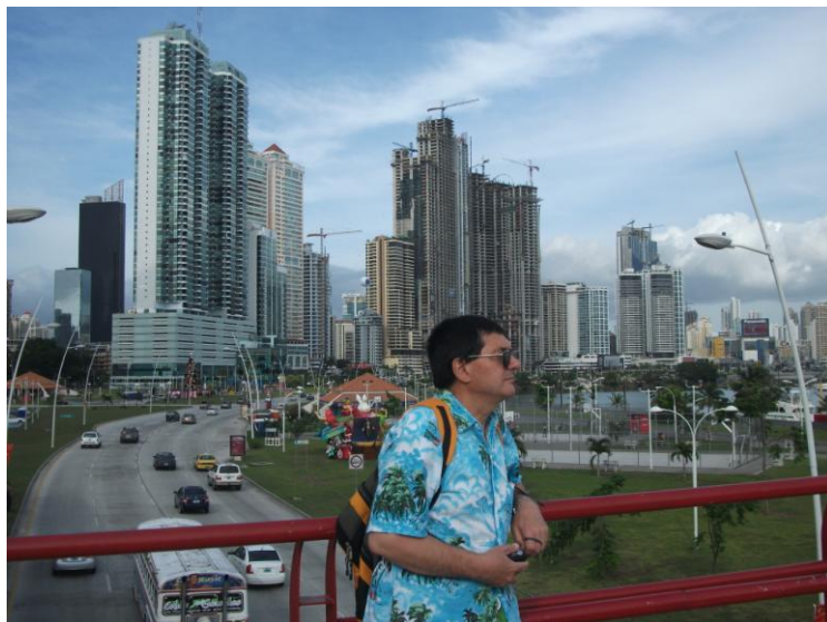
Centrul oraşului Panama

Noriega este trimis la închisoare în Florida pentru trafic de cocaină. Eliberat în 2007.