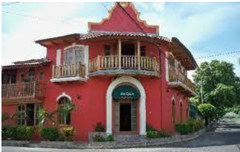
Hotelul Don Quijote

10 $ viza nicaraguană – ne-o dau pe aeroport. 15 $ taxiul până la Hotelul Don Quijote din Managua. 50 $ camera pe noapte. Curată.