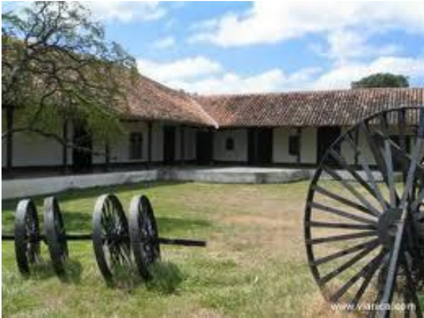
Muzeul din Rivas

Agricultura a început din anii 300 î.C. pe aceste meleaguri.