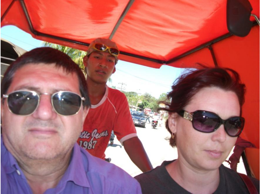
Autorul și soția în velatricicletă

Un tip îmi zice că americanii din nord se numesc gringos și ei au mucho verde [mult verde, adică dolari].