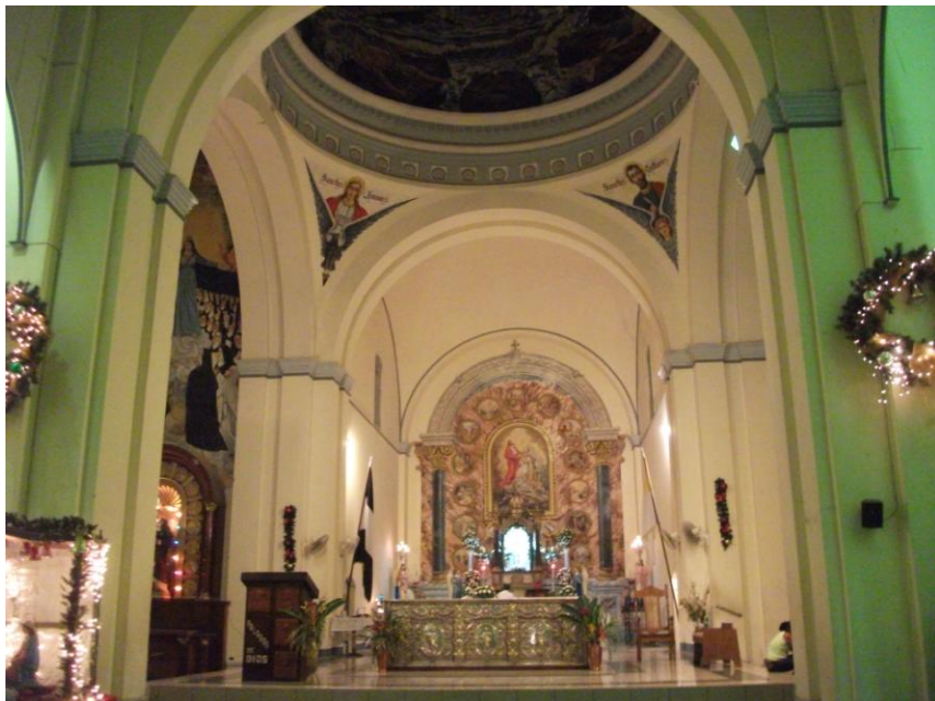
Parohia Catolică din Liberia, Costa Rica