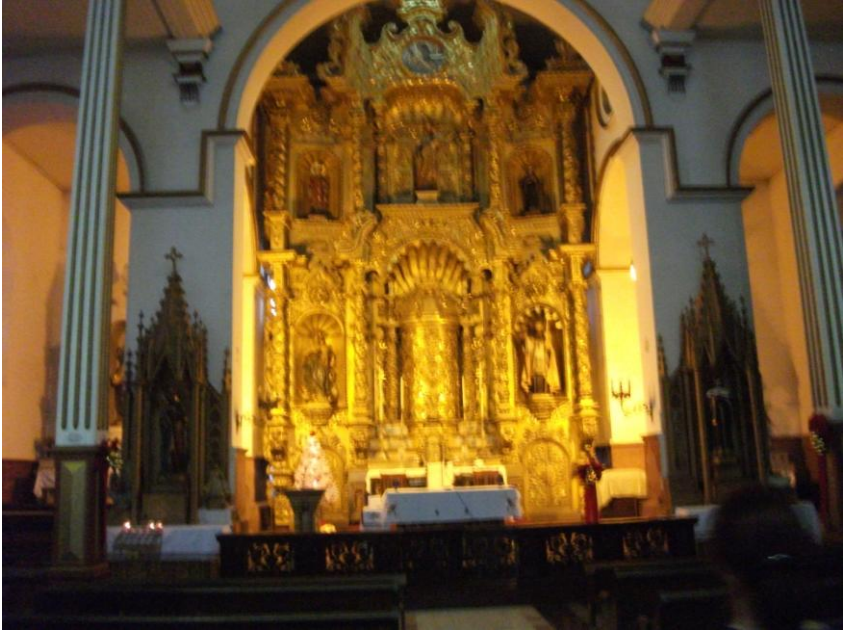
Altarul de Aur al Bisericii San José din Panama