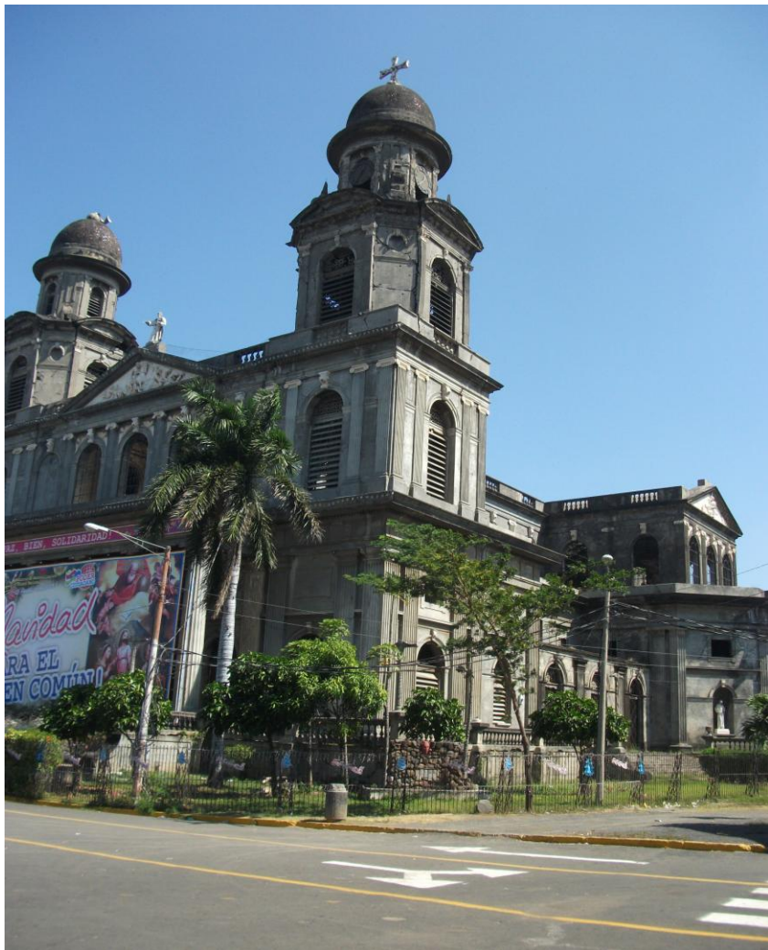
Catedrala Santiago de Los Caballeros