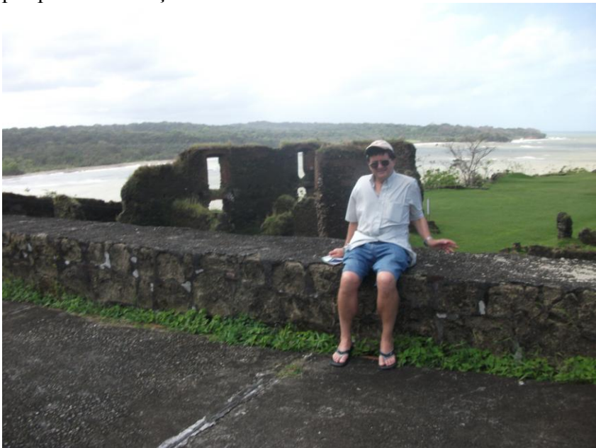
Ruinele Fortăreței San Lorenzo, Panama

Cu 120 de soldați ia fortul în stăpânire și-i face prizonieri pe spaniolii rămași.