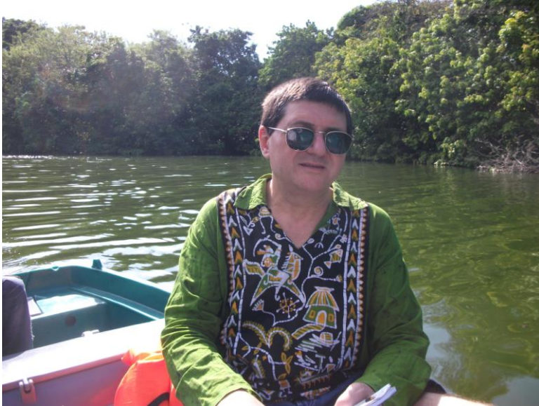
În Granada, Nicaragua, cu barca

39 $/h un tur cu barca electrică la insulețe. De la NicarAguaDulce (compania din portul Granada).