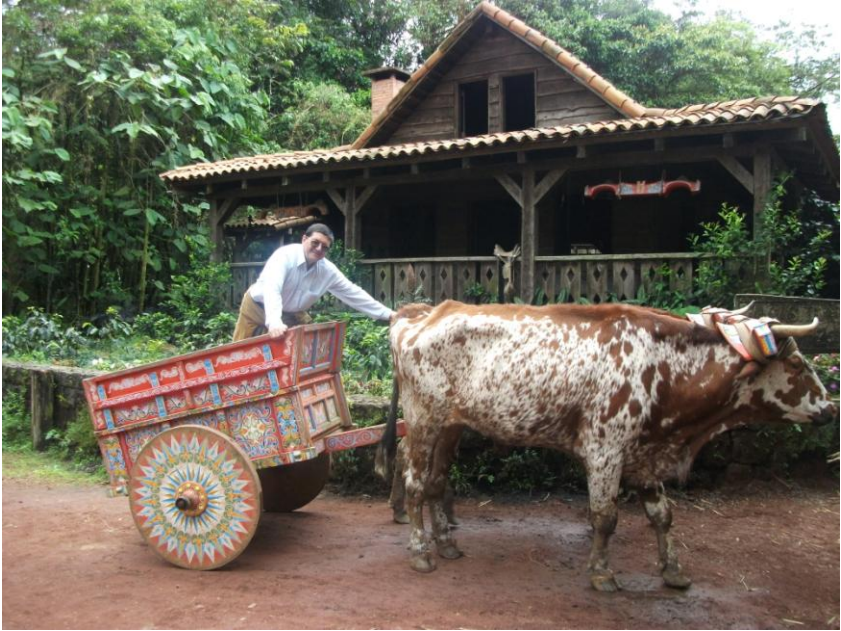
Viața la țară (în Costa Rica)

Intrăm într-un depozit cu saci de fertilizante. Cafeaua este uscată, descojită și curățată, prăjită.