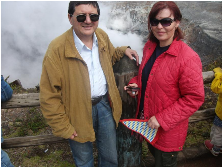
La Craterul Poás și Laguna Botos

Din Poasito pe cărarea săracilor (Sombrilla del povres), până la Craterul Poás și Laguna Botos .