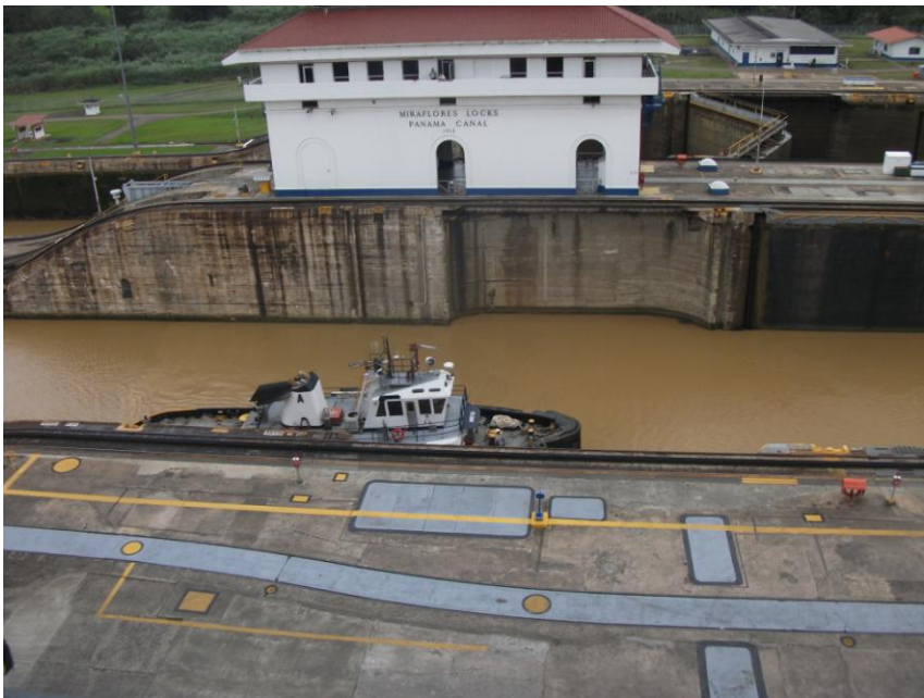
Ecluză Miraflores a Canalului Panama

Și Música Panameña e scumpă (un DVD costă 21.40 $).