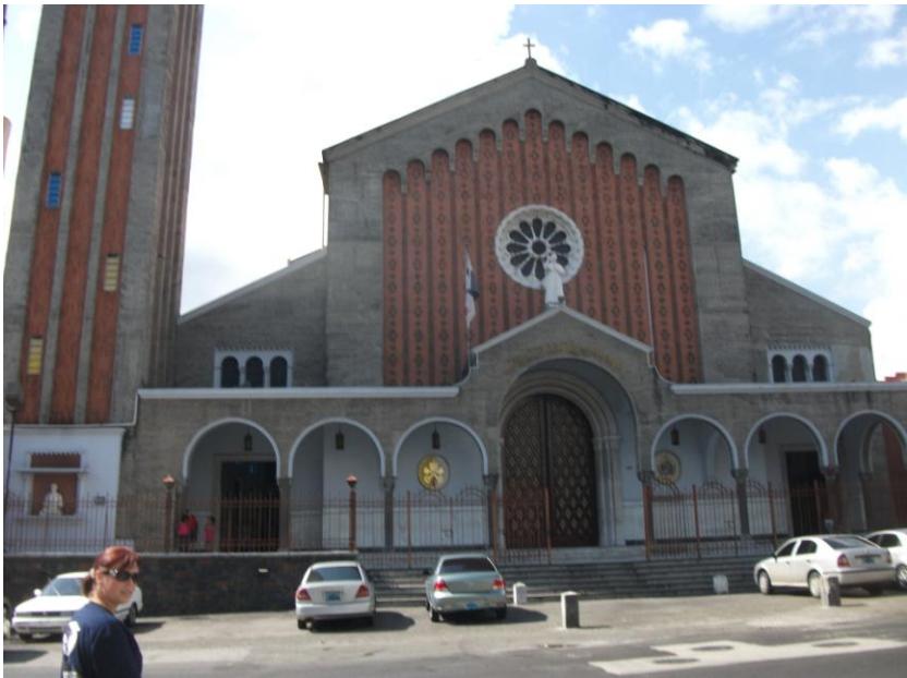
Bazilica Don Bosco din Ciudad de Panamá

În Bazilica Don Bosco din Ciudad de Panamá.