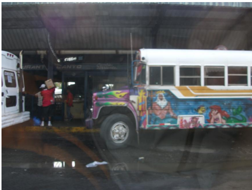
Autobuz multicolor în Colón, Panama

Îmi plac autobuzele lor de oraș: vopsite în multe culori vii... ca niște vehicule de bălci.