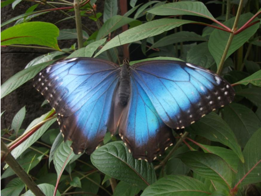
Fluture de junglă

Fluturii sunt considerate insecte și fac parte din ordinul LEPIDOPTERA. Au 6 picioare.