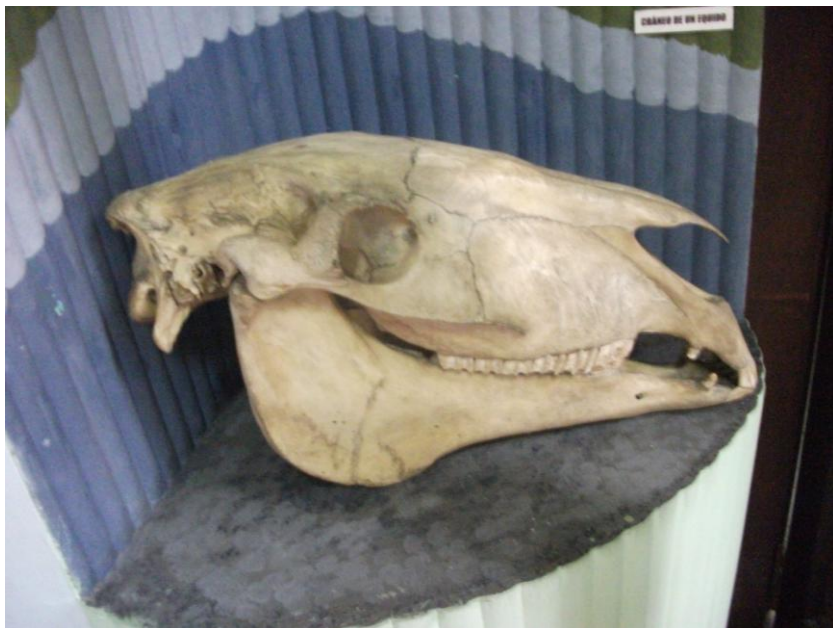
Craniul mamiferului Equido

Oasele unui animal uriaș de-acum 50000 de ani: perezoso gigante . Strămoșul calului, asinului, caprei și câinelui: Equido , care-a trăit acum 55 de milioane de ani.