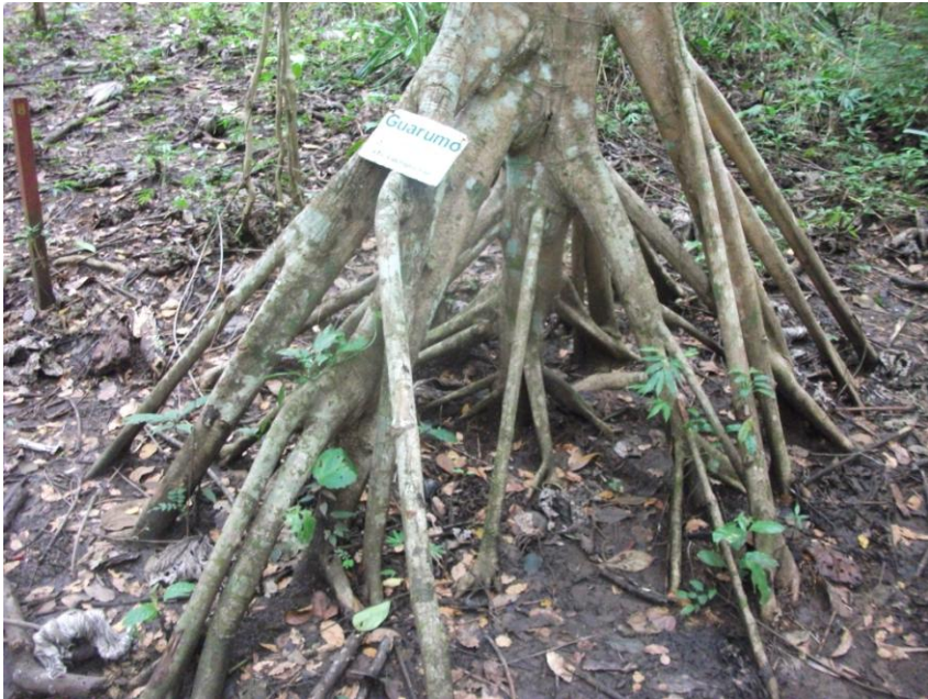
Arborele Guarumo cu rădăcini aeriene în Panama

Un arbore cu rădăcini la suprafață: Guarumo ( Cecropia peltata ).