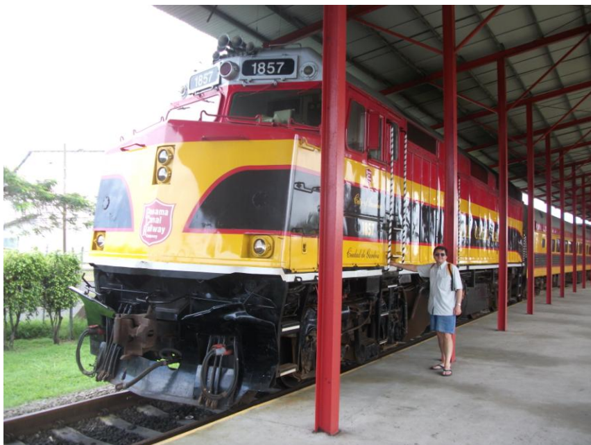
Pe peronul gării din Colón, Panama

Parohia Nuestra Señora del Carmen , din Ciudad de Panamá, Via España.