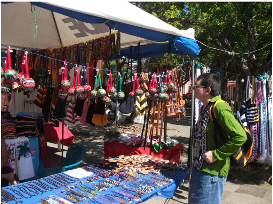
Artizanat în Granada, Nicaragua

Zona Comercială din Granada. Strada principală plină de lume.