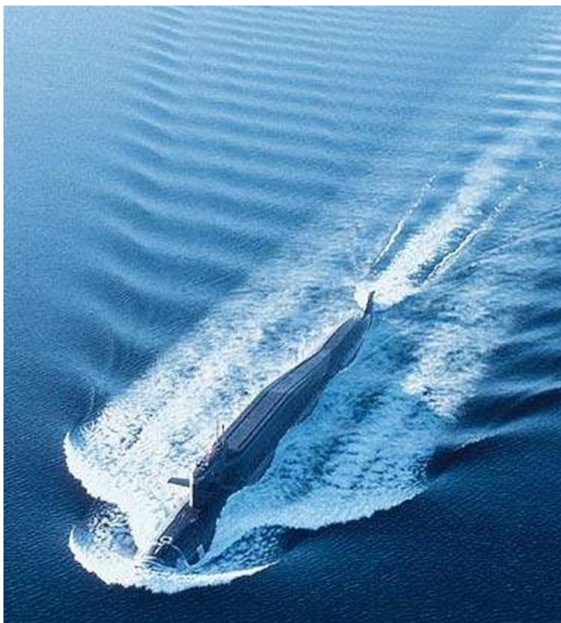
Рис.1 Кильватерные волны на воде.

Одним из экспериментальных фактов, который явился бы чрезвычайно сильным аргументом в пользу Абсолютного Пространства-Времени (далее АПВ ), оказалось бы обнаружение Кильватерных гравитационных волн (далее КВ ). Идея существования таких волн была высказана нами в [3], как следствие из гипотезы Абсолютного Пространства-Времени и идеи геометризации гравитации.