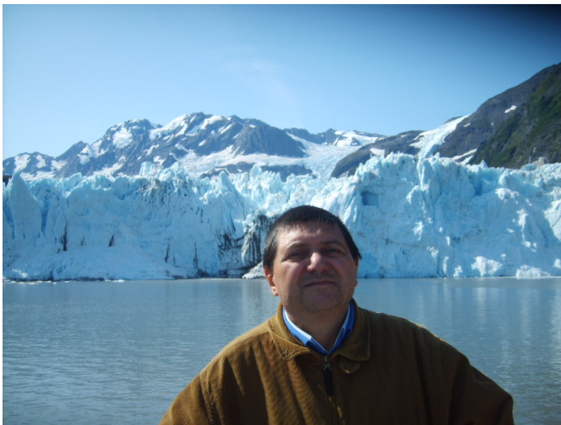
Ο Φλωρεντίν Σμαρανδάκε στην Αλάσκα (Αύγουστος 2009)

Ο Δρ. Φλωρεντίν Σμαρανδάκε είναι πολυμάθης : ως συγγραφέας, συντάκτης, μεταφραστής, συν-μεταφραστής, επιμελητής, ή συν-επιμέλητης σε 143 βιβλία και 183 επιστημονικές εργασίες και σημειώσεις .