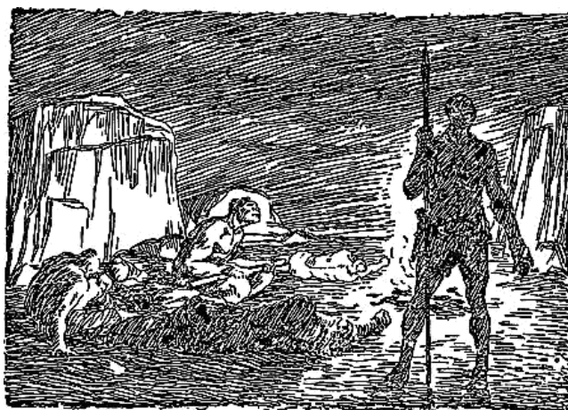
Рис.6. Сторожевые кзамы у ночного костра (Ж.Рони Старший «Борьба за огонь» рисунок Н.Н. Вышеславцева)

С переходом от пассивного бодрствования сидящихся не заснуть ночных стражей Рис. 6.