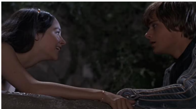
Fig. 5. – O, swear not by the moon, the inconstant moon

Incidentally, the English word LOVE also means ЛЮБ (catch), similar to the Russian ЛЮБИТЬ (to catch) (pronounced ЛАВЬИТЬ ). That is, it is also a reference to the moon, in the light of which lovers look and behave like those caught in its invisible net (Fig. 5).