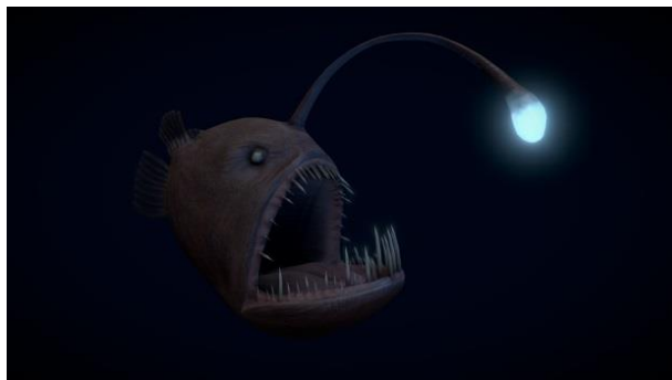
Рис. 4. Глубоководные рыбы тоже освоили приманку имитацией света Луны.

Между прочим, английское LOVE, в произношении ЛАВ, тоже означает ЛОВ, аналогично русскому ЛОВИТЬ (в произношении – ЛАВѢТЬ). То есть это тоже обозначение ЛУНЫ.