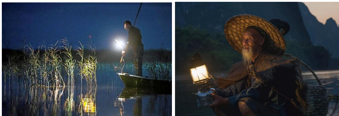
Fig. 2. Light fishing to imitate moonlight at night

Moonlight, which seems so close in the full moon phase, also attracts animals and sleepwalkers trying to reach for it (Fig. 3).