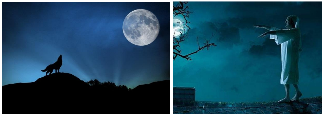
Рис. 3. Лунатиков и животных неодолимо притягивает лунный свет

Лунный свет особенно в фазе полной ЛУНЫ, кажущийся таким близким, также притягивает животных и спящих лунатиков, силящихся до него дотянуться Рис. 3.