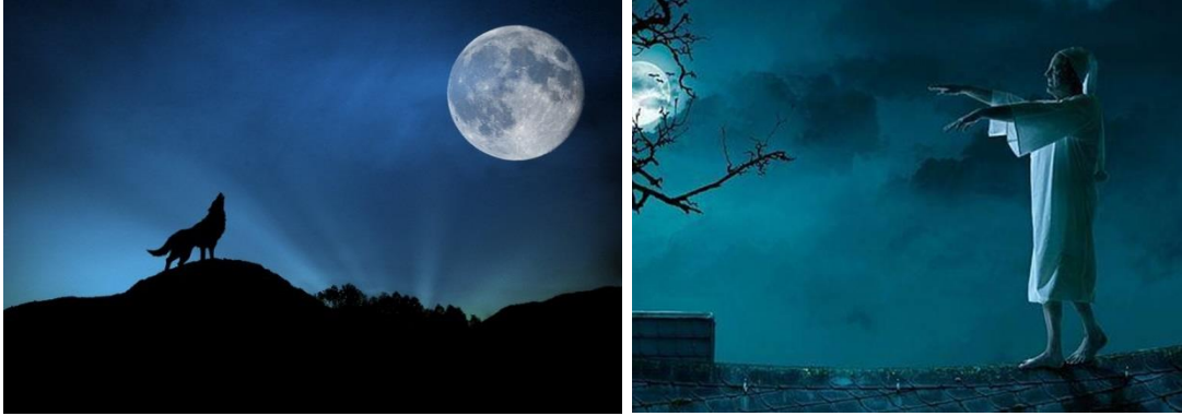
Fig. 3. Sleepwalkers and animals are irresistibly attracted to moonlight