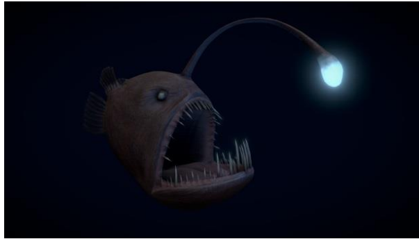
Fig. 4. Deep-sea fish have also mastered the lure by imitating the light of the moon

Incidentally, the English word LOVE also means ЛЮБ (catch), similar to the Russian ЛЮБИТЬ (to catch) (pronounced ЛАВЬИТЬ ). That is, it is also a reference to the moon, in the light of which lovers look and behave like those caught in its invisible net (Fig. 5).