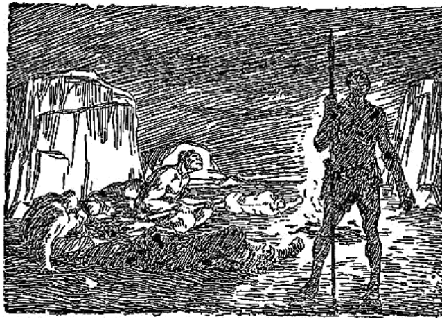
Fig.6. Kzam watchmen by the night fire (The Quest for Fire, J.-H. Rosny. drawing by Vyssheslavitsev)

With a transition from passive vigilance of night watchmen trying to stay awake (Fig. 6).