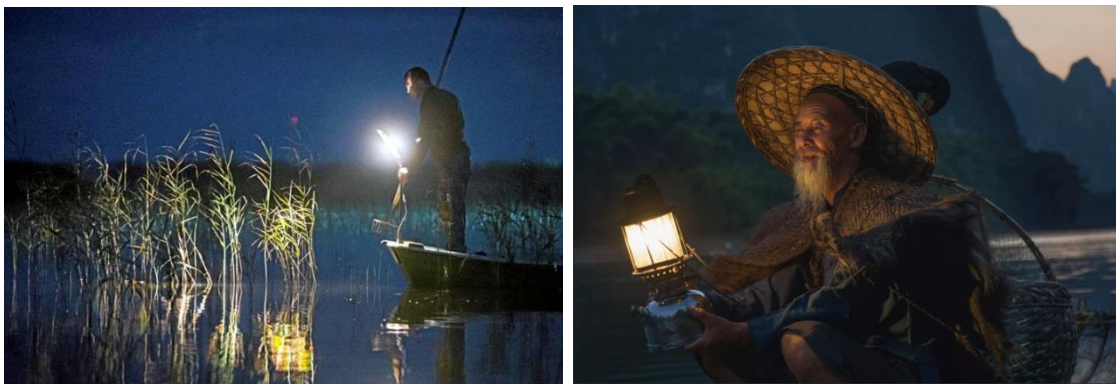
Рис. 2. Ночной рыбный ЛОВ НА имитацию света ЛУНЫ

Лунный свет особенно в фазе полной ЛУНЫ, кажущийся таким близким, также притягивает животных и спящих лунатиков, силящихся до него дотянуться Рис. 3.