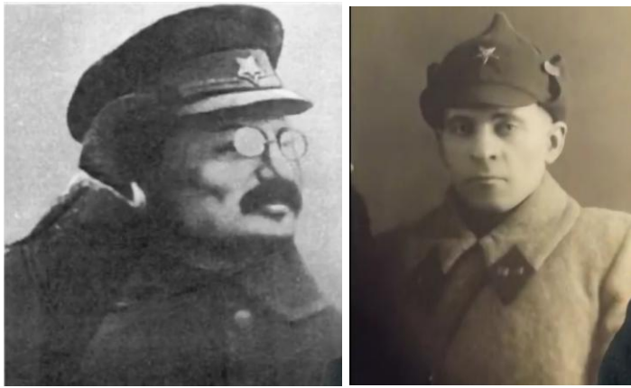
Рис. 3. Эта же пентаграмма на головном уборе времени Троцкого

Такое же положение звезды на ордене Боевого Красного Знамени, учрежденного 16 сентября 1918 года Рис. 4.