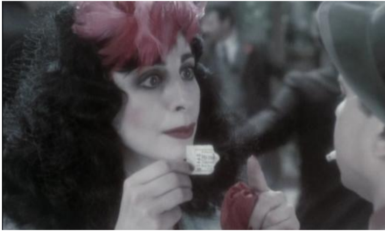
Fig. 6. Conventional sign, mark, identifying the person (film "Ball").