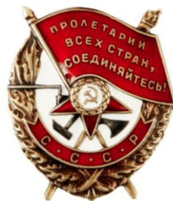
Рис. 4. Ориентация звезды на ордене Боевого Красного Знамени

Такое же положение звезды на ордене Боевого Красного Знамени, учрежденного 16 сентября 1918 года Рис. 4.