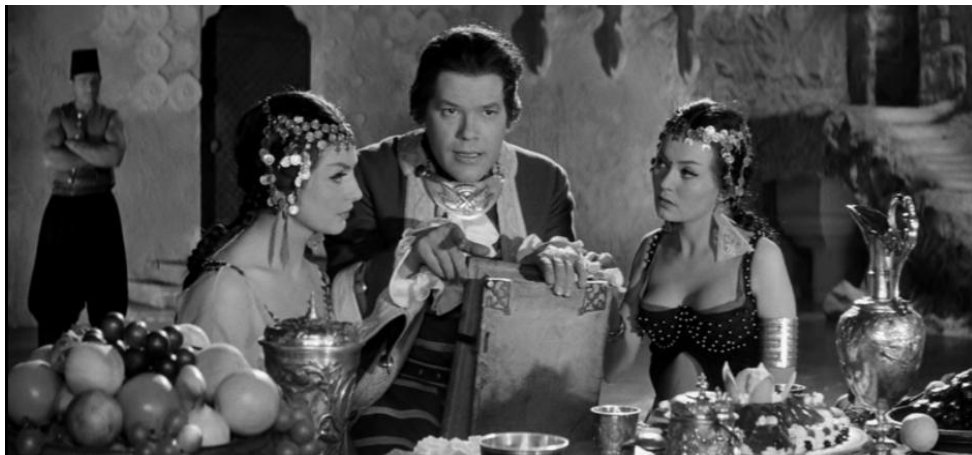
Рис. 5. – Ну, а теперь, когда мне всё известно, откройте мне, кто вы такие на самом деле?