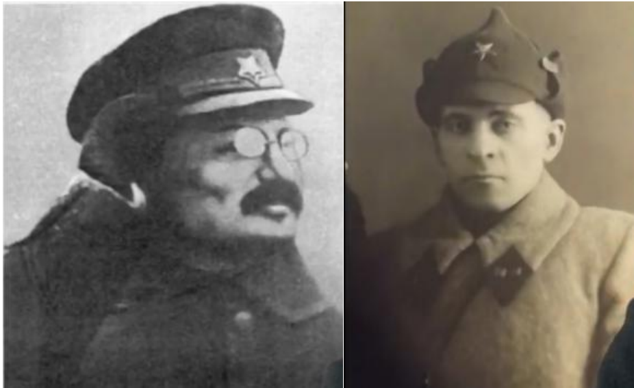
Fig. 3. The same pentagram on Trotsky's time headdress

The same star position on the Order of Wartime Red Banner, established on 16 September 1918 (Fig. 4).