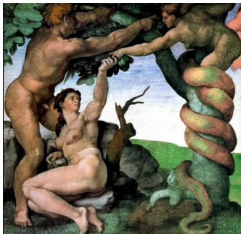
Рис. 6. Сотворенная пара И ЗМЕЙ (в сокращении -ИЗМ).

Какого именно змея здесь имеют в виду? – Библейского, разумеется, обозначающего дьявола-искусителя. Подстрекателя к нарушению любых божественных и человеческих установлений. Он и является руководителем всех этих ИЗМов Рис. 6.