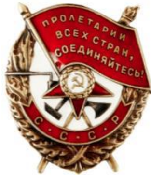
Fig. 4. The orientation of a star on the Order of Wartime Red Banner

The same star position on the Order of Wartime Red Banner, established on 16 September 1918 (Fig. 4).