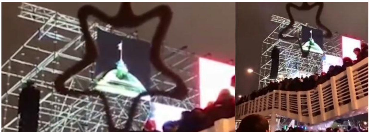
Fig. 1. The collapse of the bridge (as a SYMBOL of this country)

Here is the expected, apparently, carefully prepared wreckage of the bridge in Gorky Park in Moscow ( https://www.youtube.com/watch?v=it_UIBITqJY ).