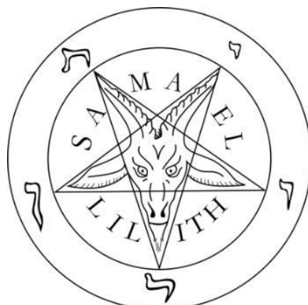
Fig. 2. The symbolic meaning of the devil , Goat of Mendes.

Who is it depicting in the process? The devil, always welcomed by revolutionaries (Fig. 2 - 3).