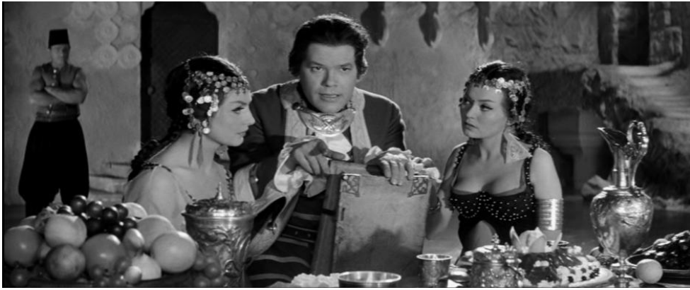
Fig. 5. – Now that I know everything, can you tell me the truth? Who are you really?