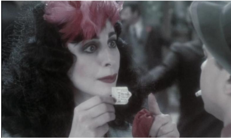
Рис. 5. Условный знак, метка, удостоверяющие личность при деловой встрече (фильм «Бал»).