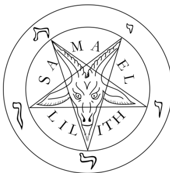
Рис. 2. Символическое обозначение дьявола – козел Мендоса.

На фоне перевернутой пентаграммы «бородой вниз, рогами вверх». Кого она при этом изображает? – Дьявола, всегда приветствуемого революционерами Рис. 2 - 3.