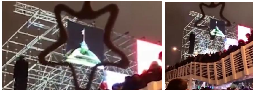
Рис. 1. Крушение моста (как СИМВОЛА этой страны), снятое в нужном месте и в нужное время

Вот ожидаемое, видимо, тщательно подготовленное крушение моста в московском парке имени Горького https://www.youtube.com/watch?v=it_UIBITqJY .