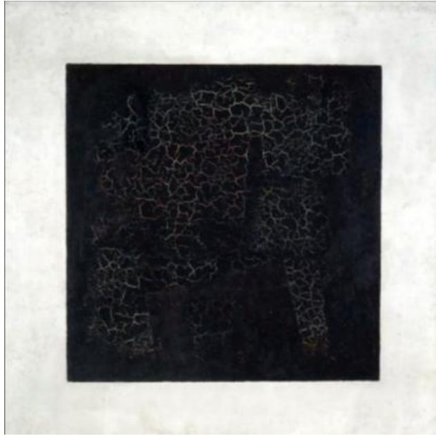
Fig. 8. The black square, the limit of the "creativity" of the biblical instigator.

He himself is incapable of creating anything positive. The limit of his "creativity" is the black square of Malevich (Fig. 8).