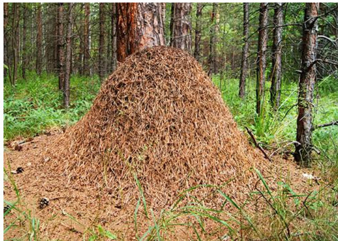
Рис. 9. Это его стабильное состояние

А что это напоминает? Внешне, конечно же, муравейник, но не такой как на рис.9.