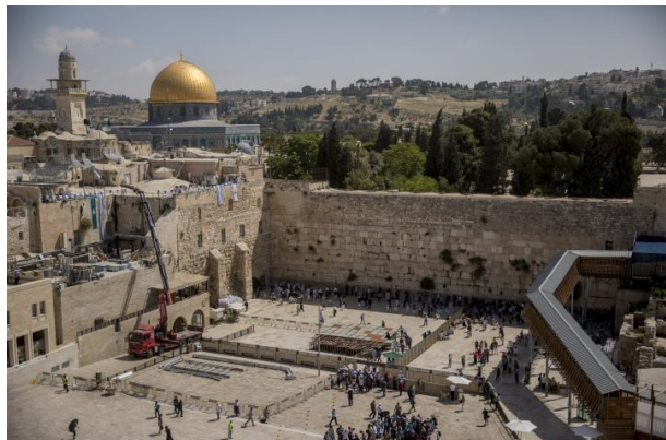
Рис. 1. Стена плача и мечеть Купол скалы.

Настоящие размышления вызваны следующим фото из Иерусалима/Аль Кудса. Где вместе изображены символы двух конфликтующих религий.