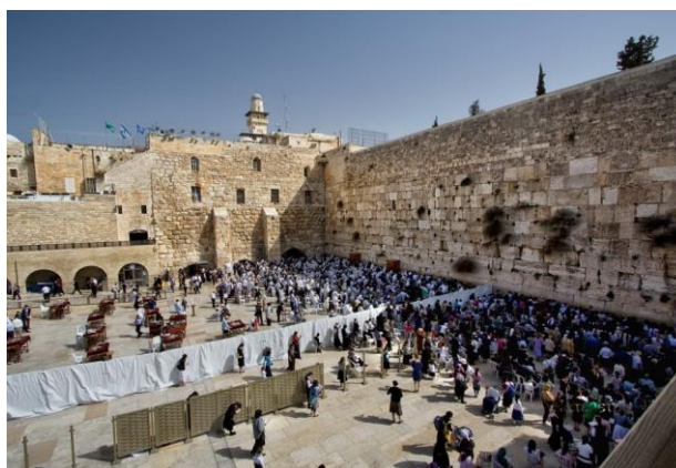
Рис. 2. Стена плача.

Обычно изображаемые в зрительном разделении рис. 2 – 3.