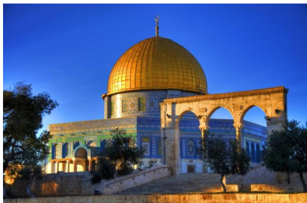
Рис. 3. Мечеть Купол скалы.