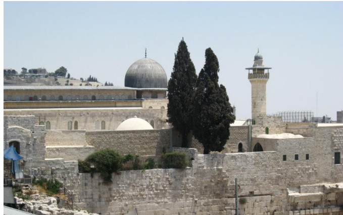
Рис. 4. Мечеть Аль Акса – третья величайшая святыня мусульман.

Рядом с которой находится третья величайшая святыня мусульманства – мечеть Аль Акса рис.4.