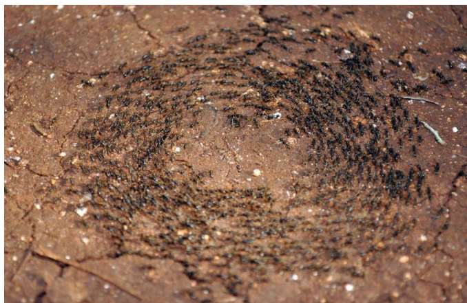
Рис. 10. Муравьи-странники, случайно образовавшие круг.

Говорят, такое движение по кругу может продолжаться до истощения и даже голодной смерти участвующих, но это, конечно, преувеличение. Однажды какая-то инициативная группа случайно отклонится немного в сторону, постепенно увлекая за собой остальных странствующих и задавая этим новый вектор движения.