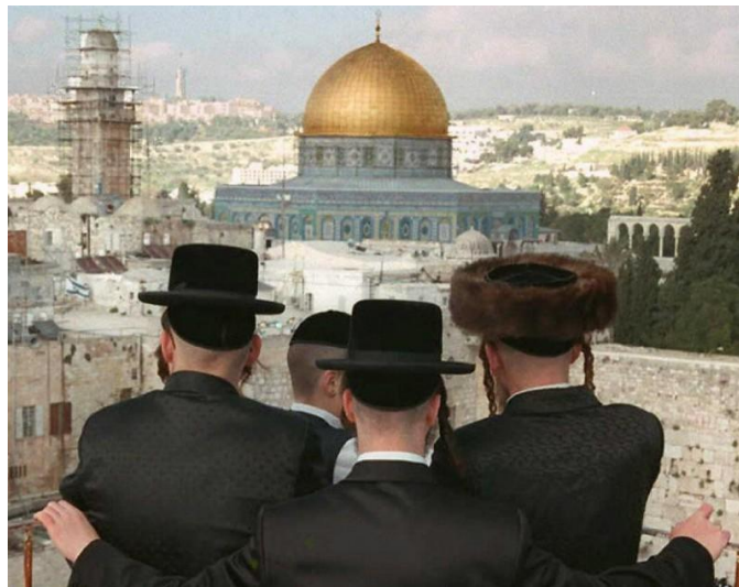
Рис. 5. Это не туристы. Прикидывают, как сделать это ловчее.

Дело в размещении этой мусульманской святыни на месте ожидаемого возрождения храма Соломона. Предполагающего ее снесение.