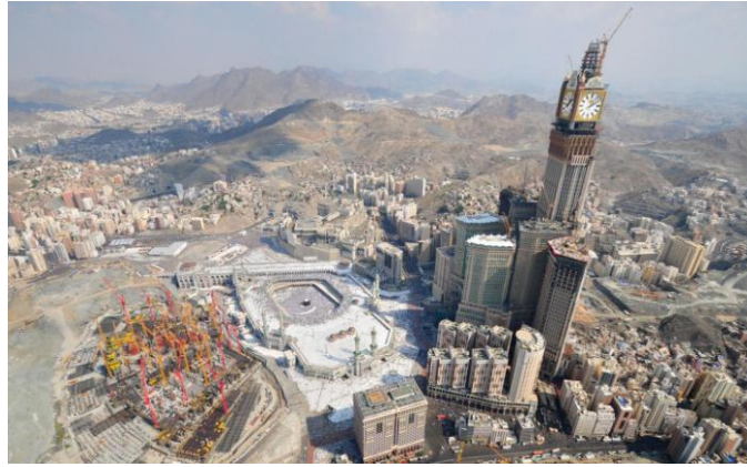
Рис.6. Мекка - центр поклонения более миллиарда верующих.