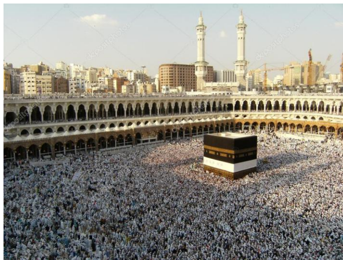
Рис.7. Точки на фотографии – это люди.

Это паломники, люди постоянно здесь не живущие, а приезжающие со всех концов света. Чтобы прикоснуться к священному Черному камню и если удастся – его поцеловать. Что позволяет очиститься от всех грехов и стать почти что святыми – хаджи.