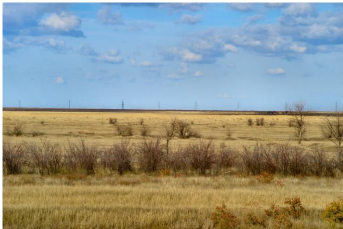
Рис. 5. Характерный степной пейзаж.

А необжитая бескрайняя степь носит другое название – ДИКАЯ степь рис.5.