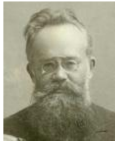
Fig. 1. The civically-minded Ukrainian historian M. Grushevskiy

The civically-minded Ukrainian people are offended by etymology of the word УКРАИНА = ОКРАИНА (BORDERLANDS), even according to M. Grushevskiy (History of Ukraine-Russia) (Fig. 1).