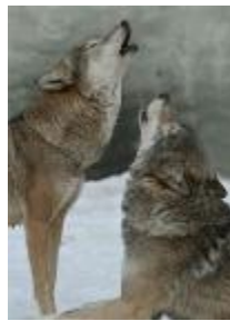
Fig. 6. БОУК-РАИНА – wolf's paradise.

Disturbing at nights by a threatening wolf howl (Fig. 6).