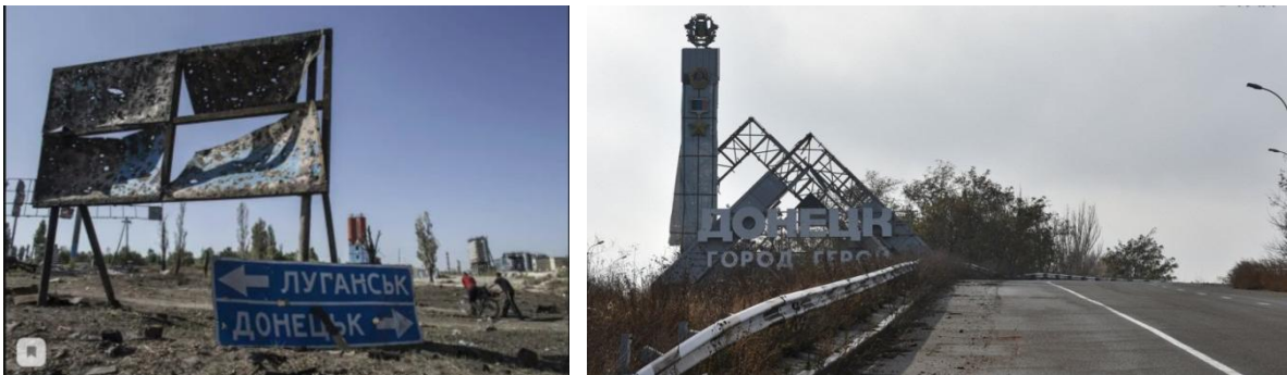
Рис. 8. Город-герой Донецк.

Столицей которой ныне является город-герой Донецк Рис. 8.