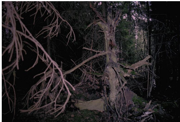
Рис. 3. Непроходимая лесная глушь.

Пугающий своей мертвящей тишиной рис. 3.