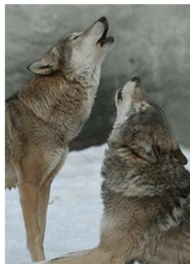
Рис. 6. ВОУК-РАИНА – волчий рай.

Тревожащая ночами далеко разносящимся угрожающим волчьим воем рис. 6.