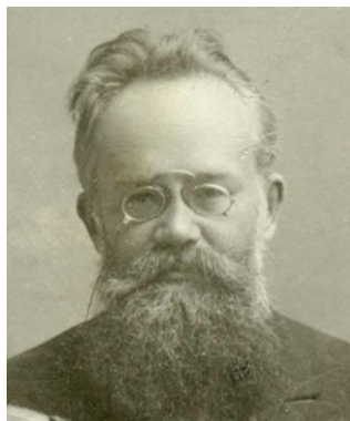
Рис.1. Свидомый историк М. Грушевский.

Свидомые разобижены этимологией слова УКРАИНА=ОКРАИНА притом даже у галицийца М. Грушевского («История Украины-Руси») рис. 1.