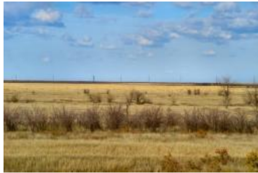
Fig. 5. Characteristic steppe landscape.

And the uninhabited boundless steppe has another name – Wild Steppe (Fig. 5).