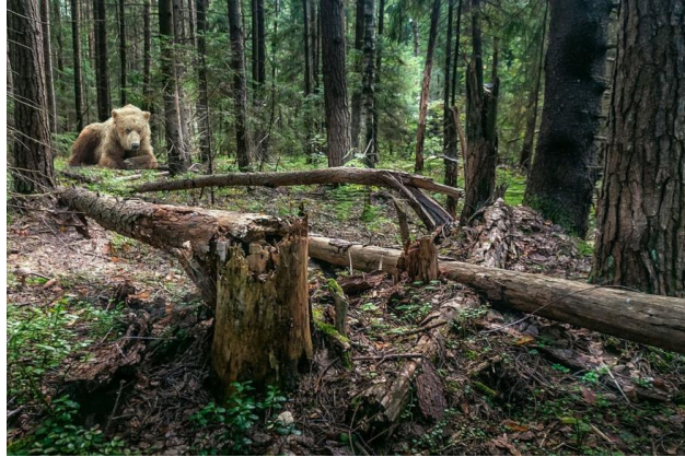
Рис. 4. УР-очище – медвежий угол.

УР это исходное наименование медведя, образованное подражанием его УРчанию. Откуда латинское имя УРсула – медведица. УР-альские горы тоже означают Медвежьи http://sciteclibrary.ru/rus/catalog/pages/12897.html .