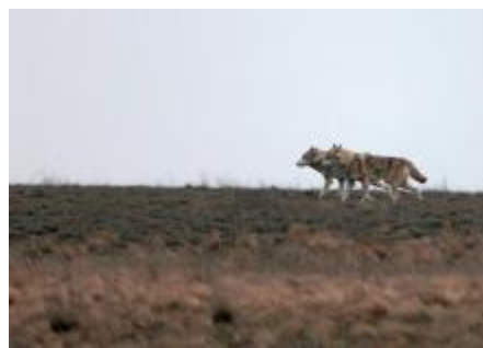
Fig. 7. Uninhabited БОУК+РАЙ-ИНА = wolf's paradise.

It was called БОУК-РАИНА – БОУК+РАЙ+ИНОЙ . That is, the WOLF'S PARADISE, since BOBK is WOLF in the Southern pronunciation (Fig. 7).