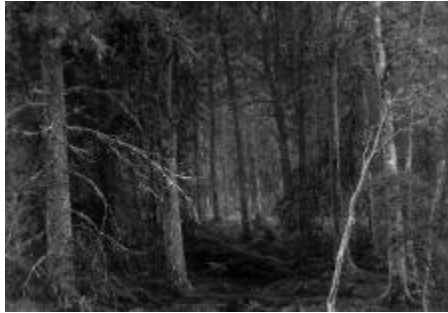
Fig. 2. Remote woodlands.

The remote woodlands are a densely wooded area where the sounds of words are muffled, deafened, not reflected, decayed and do not respond (echo), generating an alarmingly oppressive silence, causing a feeling of deafness and blindness, constantly accompanied by dusk even in light daylight hours. Dormant (dreaming, sleeping) forest, impassable, gloomy wilderness. Dusky, dark without bright sunny colours (Fig. 2).