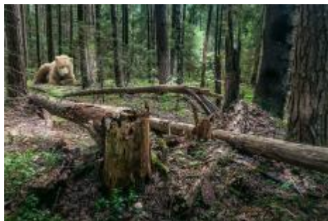
Fig. 4. УР-очище – bear's corner.

Such a forest is also called УРочище ( УР+ЧАЩА ) or медвежьим углом (bear's corner) (Fig. 4).