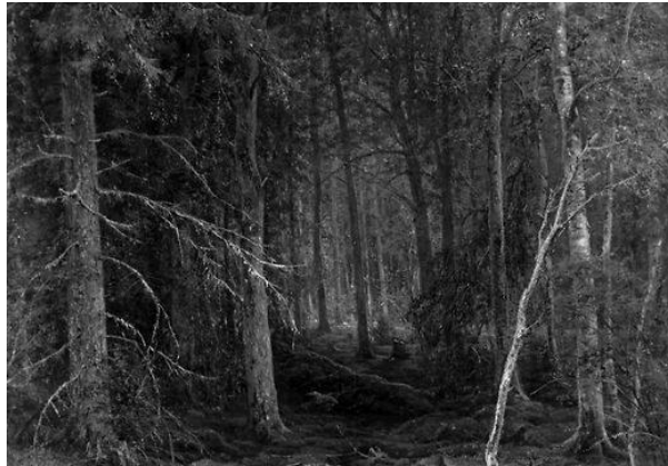
Рис.2. Лесная глушь.

Глушь – это густо поросшая деревьями местность, где звуки слов заглушаются, гложут, не отражаются, затухают, не дают отклика (эха). Порождающая тревожно угнетающую тишину. Вызывающая ощущение как будто гложущего и слепнущего. Постоянно сопровождаемая сумраком даже в светлое дневное время. Дремучий (дремлющий, спящий) лес, непроходимая, беспросветлая глушь. Сумрачный, темный без ярких солнечных красок рис. 2 .