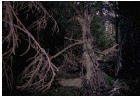
Fig. 3. Impassable remote woodlands.

Frightening with its dead silence (fig. 3).