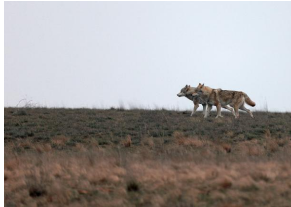
Рис. 7. Неожитая ВОУК+РАЙ-ИНА=Волчий рай.

Ее-то и назвали В ОУК-раиной – ВОУК+РАЙ+ИНОЙ. То есть ВОЛЧЬИМ РАЕМ, поскольку по-южному ВОВК это ВОЛК рис. 7.