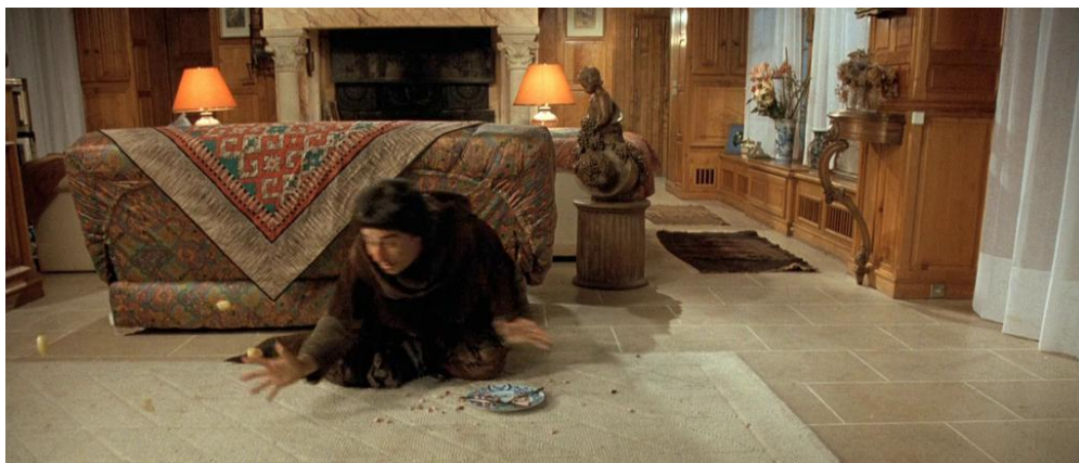
Рис. 8. Большое спасибо, синьор Юбер!

В итоге слово ДЕНЬГА=ДЕНЬ+ГА, видимо, означает дневное содержание пожалованного и соответственно дневной расход жалующего. Стоимость «дневного пайка»,