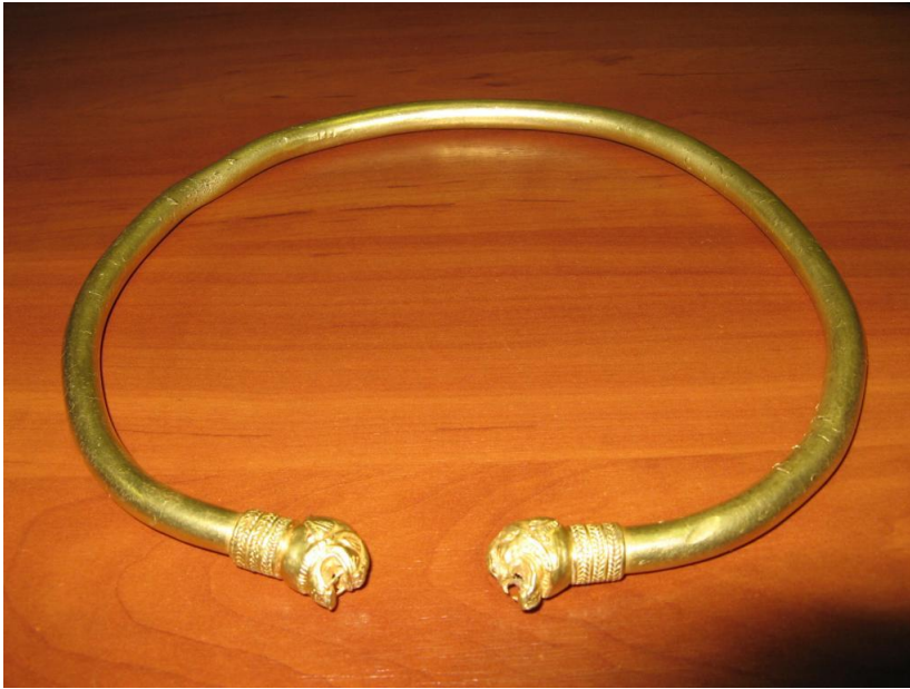
Рис. 11. Это шейное украшение тоже называют гривной.

Хотя гривнами называют также шейные украшения, явно не рассчитанные на какое-то отрубание, разве что с головой.