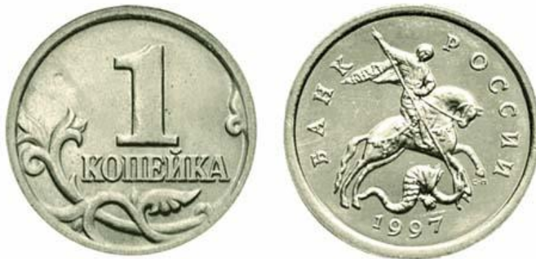
Рис. 15. Современное изображение копейного всадника, поражающего дракона.

Слово ДРАКОН, по-видимому, является вариантом слова ДРАЧУН от слова ДРАКА (в значении БИТВА).