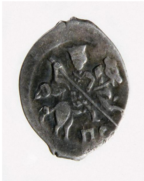
Рис. 14. Неполное изображение копейного всадника без дракона.

В позе рубящего врагов в битве. Аналогично КОПЕЙКА хотя уже и не связывается с отрезанием-отрубанием выводиться из другого изображения – всадника с КОПЬЕМ, поражающего дракона.