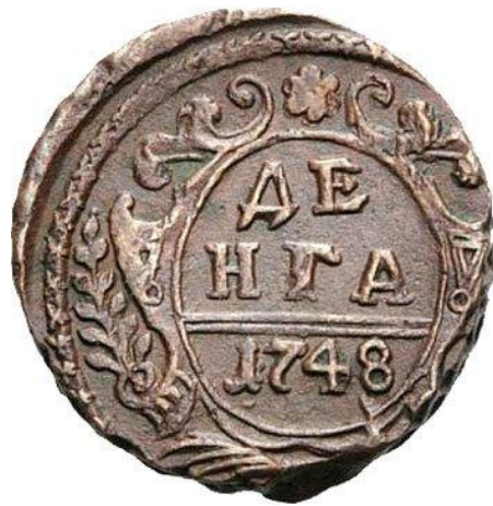
Рис. 1. ДЕНГА.

ДЕНЬГА или ДЕНГА, в тюркском произношении ТЕНГА, считается заимствованным . Что освобождает от необходимости какого-либо анализа этого слова. Имеются в виду, конечно, не тюрки-кочевники, а тюркоязычная Хазария, специализировавшаяся на сборе таможенных пошлин по линии Великого шелкового пути в Волго-Каспийском направлении.