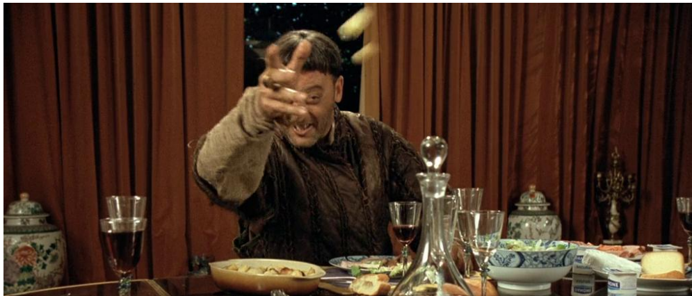
Рис. 7. Пожалованье в фильме «Пришельцы» («Les Visiteurs»). – Держи, мой преданный!

Поэтому выдача какого-либо довольствия это его бросание сверху вниз – ГА.