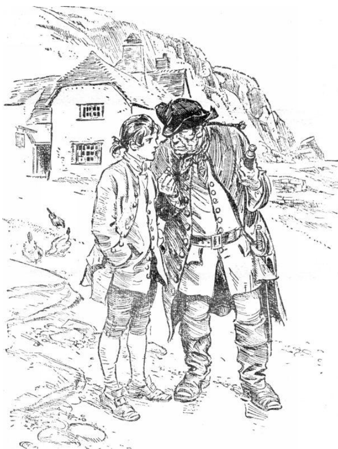
Рис. 3. Он швырнул на порог три или четыре золотые монеты.

«Когда наступало первое число и я обращался к нему за обещанным жалованьем , он только трубил носом и свирепо глядел на меня. Но не прошло и недели, как, подумав, он приносил мне монетку и повторял приказание».