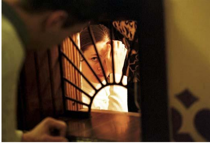
Рис. 6. Получение жалованья в позе поклона.

Дающий всегда социально выше , а получающий является нижестоящим . Дающий может сидеть, а получатель – стоять, причем окна для выдачи специально расположены на уровне сидящего, вынуждая получателя принимать позу поклона.