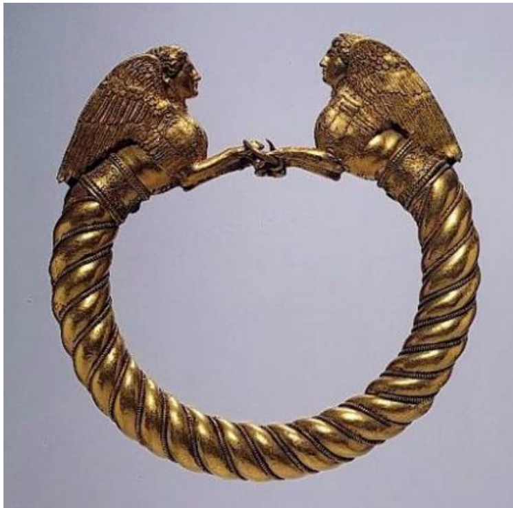
Рис. 12. И даже это якобы тоже гривна.

Имеется также слово ОТРЕЗ, например, на платье используемый в качестве заготовки .