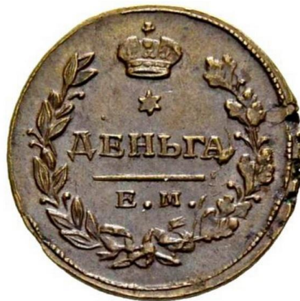
Рис. 2. ДЕНЬГА=ДЕНЬ+ГА.

Оставим, однако, эту «этимологию» и посмотрим на вероятное русское происхождение слова ДЕНЬГА. Образованное частями ДЕНЬ+ГА, вероятно, являющиеся исходными простыми словами.