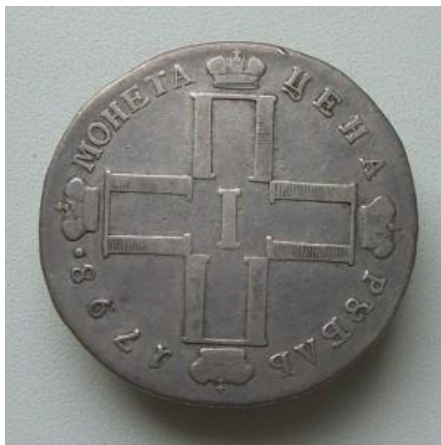
Рис. 17. Павловский РОУБЛЬ.

А что теперь можно сказать о самом слове РУБЛЬ, если это вовсе не РУБКА? Понять это не очень сложно если учесть прежнее написание этого слова с буквой ОУК – РОУБЛЬ.