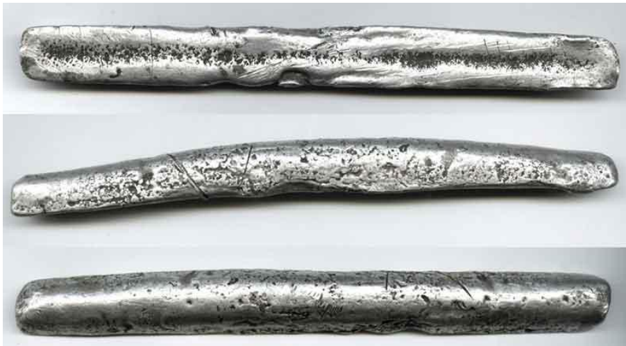
Рис. 9. Серебряный слиток, называемый гривной.

Она может быть выполнена в виде прутка или бруска металла.