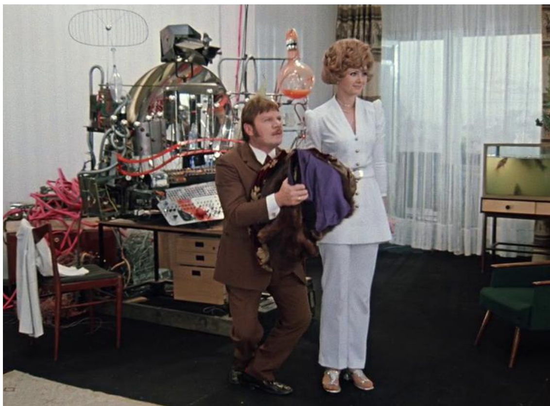
Рис. 5. Вельми понеже. Вельма вами благодарен!