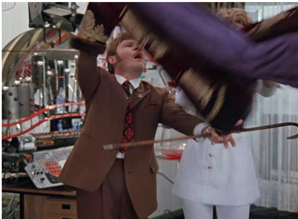
Рис. 4. Жалую тебе шубу с царского плеча!

Бросание жалованья в фильме «Иван Васильевич меняет профессию».