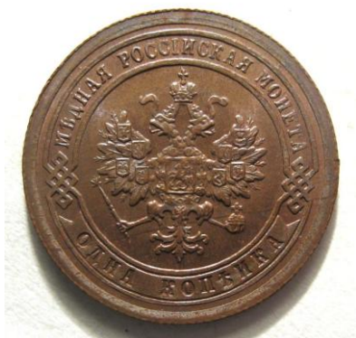
Рис. 16. Копейка с гербовым орлом.

С введением герба в виде двуглавого орла название КОПЕЙКА должно было также перемениться, официально превратившись уже в ОРЛЯНКУ. Чего, однако, не произошло. Копейка так и осталась копейкой.