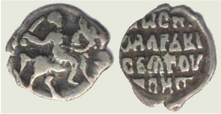
Рис. 13. Рубящий всадник.

В позе рубящего врагов в битве. Аналогично КОПЕЙКА хотя уже и не связывается с отрезанием-отрубанием выводиться из другого изображения – всадника с КОПЬЕМ, поражающего дракона.